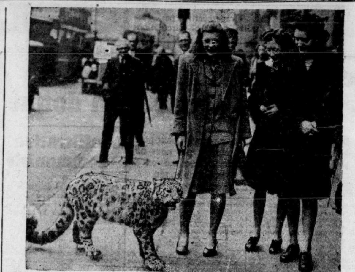
Non, il n'a pas causé de panique, bien qu'en liberté dans les rues de Londres. Ce léopard est tout simplement un des trophées en route vers les galeries d'histoire naturelle de Piccadilly.

M. Klaiman conclut en disant que les demandes de patrons faits sur mesure montrent que les personnes en dehors des grandes villes se sont adaptées très vite aux nouvelles exigences de la mode. Plusieurs de celles-ci sont très habiles à la machine à coudre et ceci leur permet d'égaliser leurs amis de la ville en se faisant elles-mêmes une garde-robe complète et de lignes nouvelles.