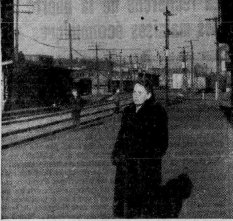
La célèbre romancière canadienne, Gabrielle Roy, détentrice du prix Fémina 1947, apparaît ici dans le milieu même qui lui a inspiré son ouvrage Florentine, Azarius ou Rose-Anna viennent de traverser cette rue... Cette scène est extraite du documentaire de l'Office National du Film CARRIÈRES ET BERCEAUX, (série En Avant Canada).