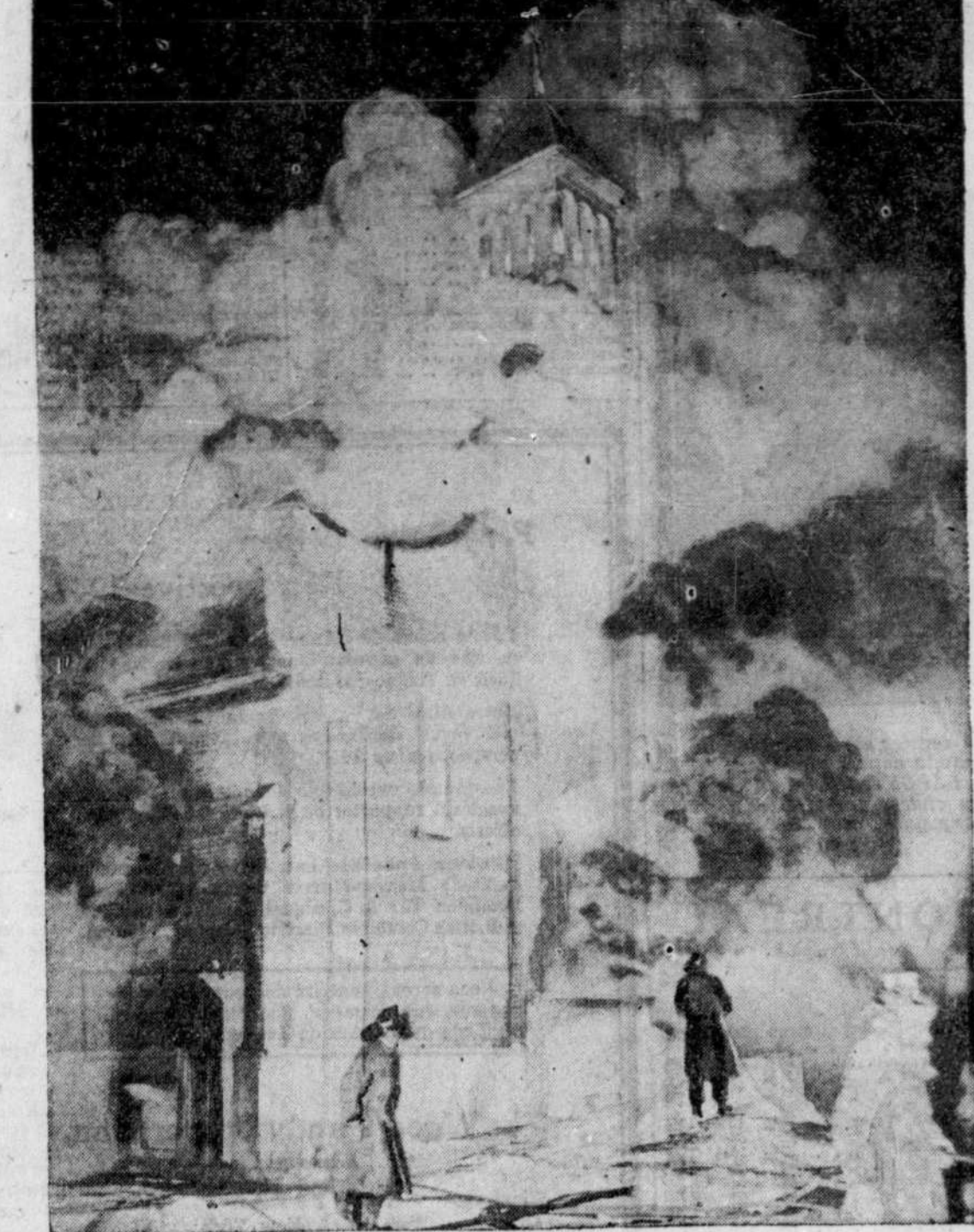
L'église St-Bonaventure, de Bellevue, près d'Ottawa, a été détruite par le feu ces jours derniers. On voit ici les pompiers combattant l'incendie. Les dommages sont évalués à plus de $100,000. Tous les vases sacrés ont été perdus dans le sinistre, malgré les efforts du curé, M. l'abbé Achille Gratton.