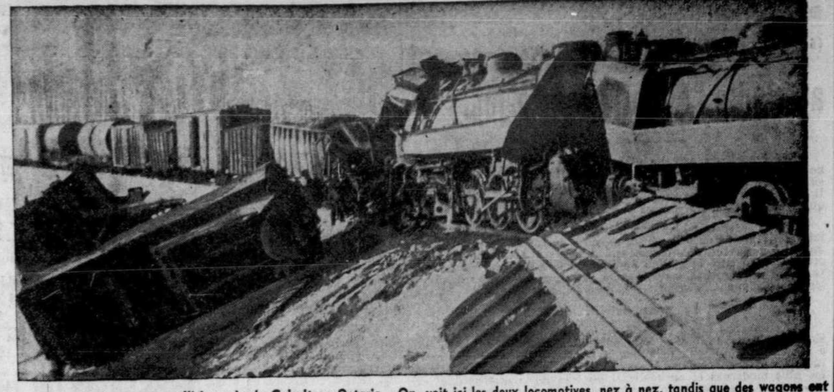
Deux trains sont venus en collision près de Cobalt en Ontario. On voit ici les deux locomotives, nez à nez, tandis que des wagons ont sauté de la voie. Le mécanicien et le chauffeur ont perdu la vie dans cet accident survenu par un froid sibérien.