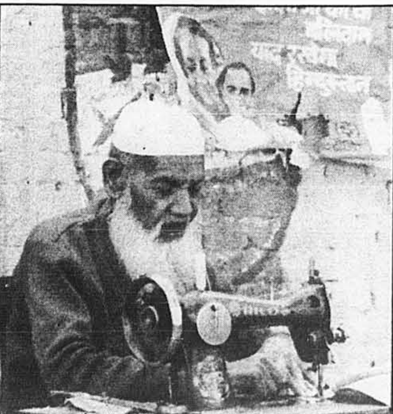
Un vieux tailleur habitant dans la circonscription de Rajiv Gandhi affiche ses préférences sur le mur de son échoppe.