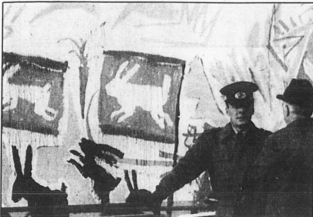
Des graffitis particulièrement éloquentes sont apparus sur le côté est du Mur de Berlin depuis que les autorités ont permis aux artistes de s'y manifester.

Enfin, la grève des mineurs de Vorkouta, dans le cercle polaire, s'essouffle et neuf des 13 puits avaient repris le travail hier au terme de trois semaines d'arrêt de travail.