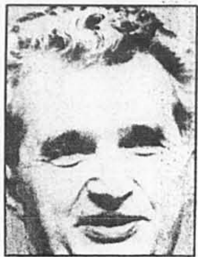
Nicolae Ceausescu

Des mesures draconiennes de sécurité entourent la tenue de ce congrès qui traduit la nervosité du numéro un roumain devant son isolement croissant en Europe de l'Est où il ne dispose plus d'aucun appui. Le pays est pratiquement interdit aux touristes, même des pays socialistes durant la période du congrès. La frontière entre la Hongrie et la Roumanie est toujours partiellement fermée.