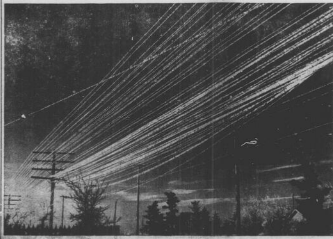
Pali telegrafici geoidi nelle praterie vicino a Calgary. Il fotografo, Harry Defus, ha scattato questa scena poco dopo l'alba in una mattina serena e gelata.

Un intraprendente ragioniere di Montreal è stato deferito all'autorità giudiziaria a seguito di una denuncia sperta da un ispettore delle tasse. Il ragioniere che lavora stabilmente presso un grande emporio a tempo tempo usava riempire per conto terzi i moduli delle tasse. L'ispettore ha trovato che fra le 76 infrazioni commesse dal ragioniere, quest'ultimo aveva incluso per ottenere l'esenzione figli mai nati, mogli mai esistite, parenti già da tempo in tomba.