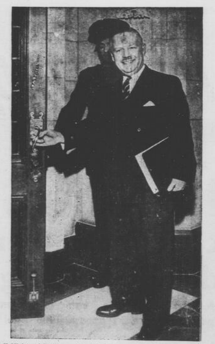
Il Ministro delle Finanze Donald Fleming: "Bisogna ridurre al minimo il deficit del Bilancio" e... il suo bilancio è stato molto criticato.

Il Canada ha ceduto al Belgio due mila adibite a guardia costiera nel piano della NATO. Secondo gli esperti del mercato due nuovi tipi di "cigarretto" comprendono il corpo di una sigaretta contenente tabacco normale misto a tabacco forte. L'involucro esterno sarà rappresentato da una foglia di tabacco anziché la solita cartina. Il "cigarretto", che dovrebbe assomigliare all'italiano "Avana", verrà fabbricato usando le solite macchine per sigarette e viene messo in vendita dall'Imperial Tobacco Co.