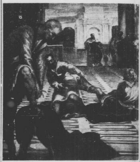
Una parte dell'enorme dipinto "Cristo lava i piedi dei suoi discepoli" del pittore italiano del Rinascimento "Il Tintoretto" (Giacomo Robusti), che è esposto alla Toronto Art Gallery. L'enorme dipinto è uno dei più spettacolari e di valore mai esposti alla Galleria. Fu riscoperto solo tre anni fa in Irlanda e fu portato a Toronto con l'idea di poter riunire abbastanza denaro per comprarlo. Il pubblico è invitato a sottoscrivere, comprandolo al prezzo di $10 al pollice quadrato. (Canadian Scene)

OTTAWA. — Il Primo Ministro canadese, John Diefenbaker, ha rivelato ai Comuni che il governo canadese ha inoltrato presso gli Stati Uniti una protesta contro il progetto di unire di una quantità addizionale d'acqua dei Grandi Laghi. "Chi danneggerebbe non indifferente la popolazione del Canada canadese, e nei riguardi dei rapporti tra i nostri due paesi — dichiara la nota inoltrata. Il progetto, che rappresenta una fonte di irritazione profonda che noi non sapremo ulteriormente tollerare."