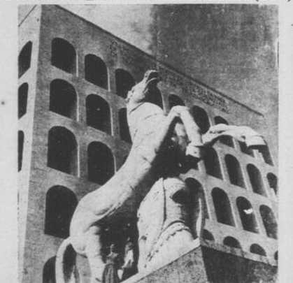
Si è proceduto durante questi ultimi anni alla riparazione degli ingenti danni che la guerra e l'abbandono avevano causato ai superbi edifici destinati ad accogliere l'Esposizione Universale di Roma. Questa zona diverrà certamente uno dei più importanti quartieri della Capitale. Nella foto: il palazzo della Civiltà