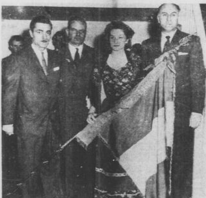
Questa foto è stata scattata nella sede dell'Alitalia in Montreal, in occasione della consegna della bandiera trasportata dal aereo, all'Associazione Friulana della metropoli.