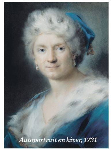
Autoportrait en hiver, 1731

C'est dans ce contexte que Carriera décide, en 1731, de produire un autoportrait qui en déconcerte plus d'un. Son Autoportrait en hiver (ci-dessous) n'a rien à voir avec un portrait de femme habituel. Il est difficile d'ignorer que ses traits sont très masculins ; elle ne porte pas de maquillage, l'on ne remarque pas les joues et