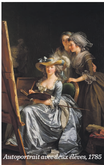
Autoportrait avec deux élèves, 1785

Ayant réussi à officiellement exercer la profession de peintre depuis ses vingt ans, elle se débat pour faire en sorte qu'un plus grand nombre de femmes soient reconnues dans le milieu artistique et puissent en faire leur métier. C'est donc dans cette optique qu'elle peint, en 1785, son Autoportrait avec deux élèves . Sur ce portrait, Adélaïde décide de se représenter en tant que femme active et occupée, ce que l'on voit rarement dans les représentations de femmes à l'époque. De plus, elle pose avec deux de ses élèves, ce qui montre non seulement qu'elle est capable d'enseigner (les maîtres d'art étant essentiellement des hommes), mais aussi qu'elle cherche à forger la prochaine génération de femmes artistes peintres. Enfin, elle affirme sa position en regardant directement le spectateur, mais sans pour autant lui dévoiler ce qu'elle est en train de peindre.