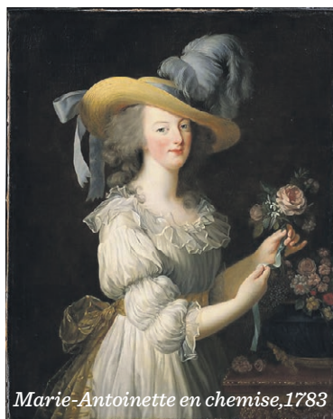
Marie-Antoinette en chemise, 1783

Si, aujourd'hui, après un premier coup d'oeil à la peinture ci-dessous, l'on pourrait penser que l'on est face à un portrait comme un autre, celui-ci est en réalité rapidement retiré de la sphère publique, car il est jugé choquant pour l'époque. La reine porte sur ce portrait une robe de chambre — un habit considéré bien trop intime pour être représenté en peinture —, ne porte également aucun bijou et pose dans un milieu qui semble mystérieux, sûrement sa chambre.