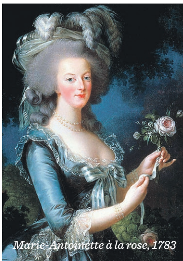
Marie-Antoinette à la rose, 1783

En guise de réponse, Vigée Le Brun exécute deux autres portraits afin de rassurer le public : un portrait de la reine avec ses enfants et un portrait sur lequel Marie-Antoinette est représentée conformément au portrait initial. Elle y affiche la même expression, la même posture et le même teint rosé. Seulement, cette fois-ci, elle est vêtue d'une robe flottante et pose en pleine nature, comme le veut la bonne conduite. On peut y voir une réponse ironique de la part d'Élisabeth Vigée Le Brun, qui se moque ouvertement des critiques et de leurs normes en leur délivrant un portrait quasiment