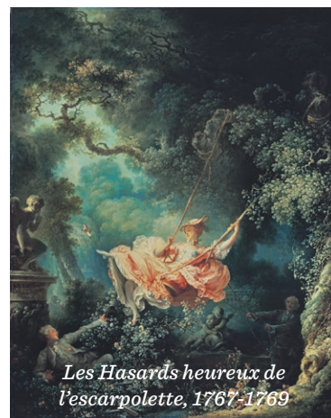
Les Hasards heureux de l'escarpolette, 1767-1769

La carrière de Rosalba Carriera prend naissance alors que le courant artistique et architectural du rococo est en essor en Europe. Ce mouvement donne la priorité à la qualité esthétique et met souvent en scène des thèmes tels que l'amour, la passion et la beauté, dans des jardins pittoresques ou des salons à la décoration exubérante. La technique du pastel est souvent la favorite des peintres rococo, car celle-ci permet de manier des jeux de lumière et d'incorporer une certaine fluidité au sein de leurs oeuvres, dans laquelle de beaux courtisans et de jeunes bourgeoises sont souvent mis en scène en mouvement, en train de jouer ou de s'enlacer de façon théâtrale. Les femmes sont elles aussi