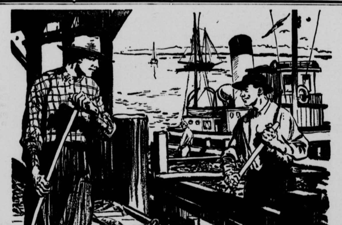
LES CANADIENS ET LEURS INDUSTRIES — ET LEUR BANQUE