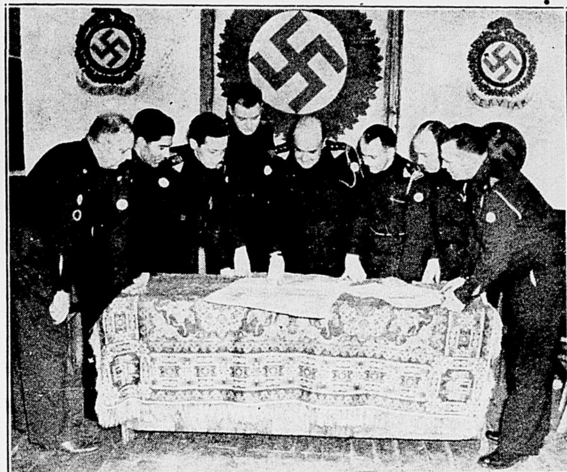
L'Etat-Major des légions fascistes, en uniformes, étudiant une carte. — Est-ce en vue de la "marche" sur Ottawa, ou pour repérer des "caches" d'armes?