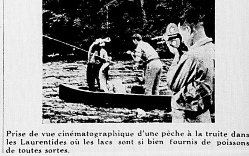
Prise de vue cinématographique d'une pêche à la truite dans les Laurentides où les lacs sont si bien fournis de poissons de toutes sortes.

Triomphe au camp français. Une Delahaye a battu une Mercedes. Je veux bien croire que la virtuosité du pilote joue un rôle aussi important que celui d'un jockey sur un cheval. Il n'en reste pas moins que c'est le cheval qui gagne, et non le jockey. Au reste, ce sont là des chicanes. Chaque sport a ses nécessités et ses lois. Si j'insiste, ce n'est pas pour discuter la valeur athlétique d'hommes comme René Dreyfus; c'est seulement parce que cela m'agace quelquefois d'entendre dire: "Comment? Je ne fais pas de sport? Je conduis!" Pierre BOST.