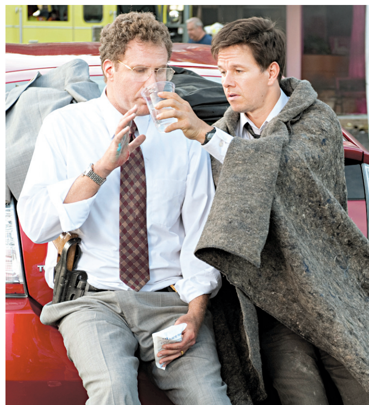
Will Ferrell et Mark Wahlberg dans The Other Guys , d'Adam McKay