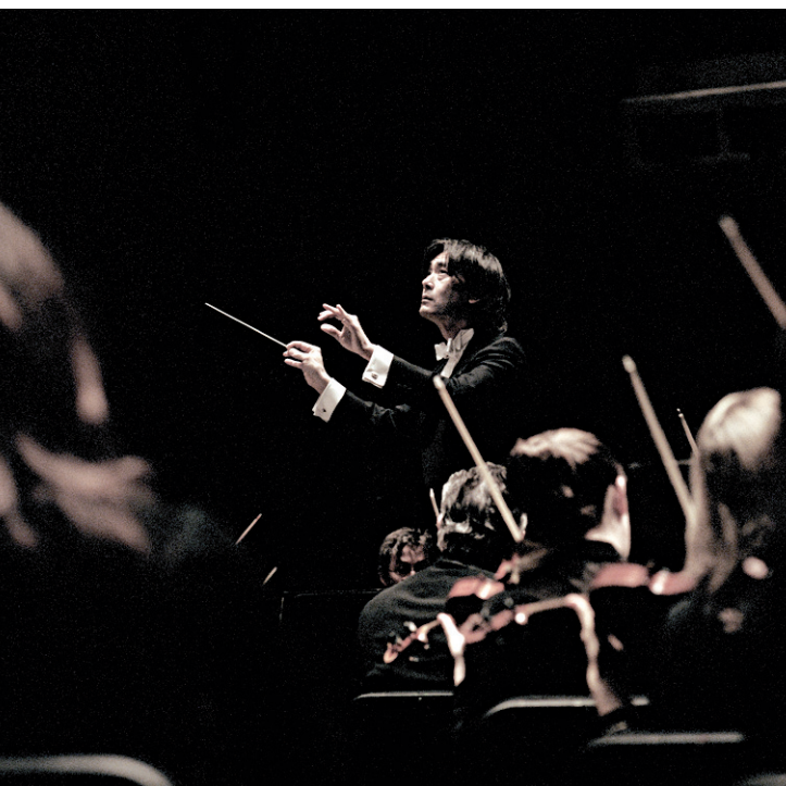
Kent Nagano à la tête de l'OSM