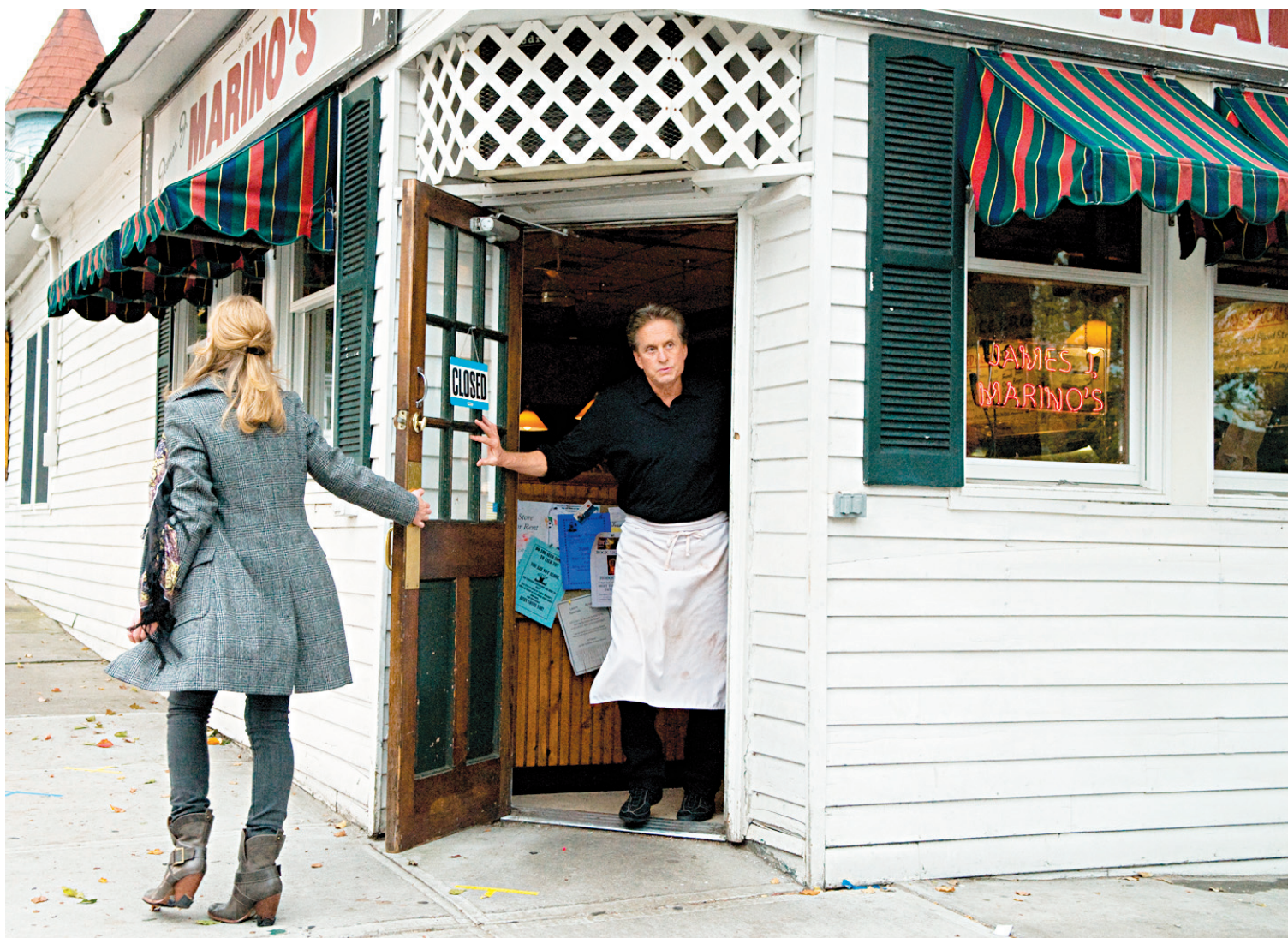
Michael Douglas dans Solitary Man de Brian Koppelman et David Levien

L'action se déroule à New York, et ce Ben, jadis roi de la concession automobile, qui a dérapé et en accumulant les mauvais choix sentimentaux, familiaux et professionnels, s'enfoncé dans tous les gouffres, poussé en partie par un amour im-