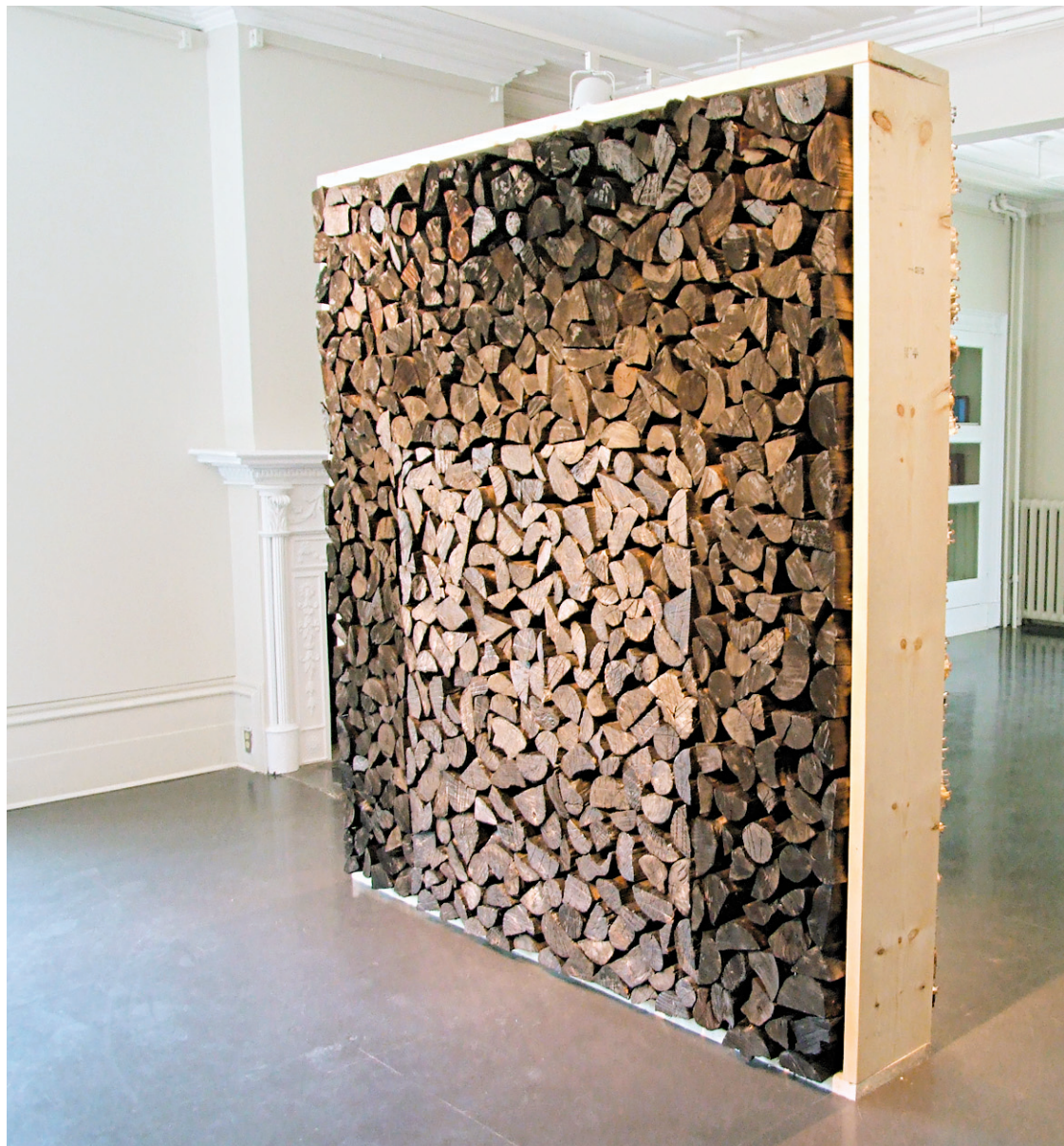
L'œuvre de Rebecca Belmore à la Biennale de sculpture contemporaine de Trois-Rivières

De Gilot, comme de Moreau ou de Manuela Lalic, autre figure connue pour ses installations en faux-semblants, on nous propose des œuvres caractéristiques de leur pratique. Sans grande surprise. La volonté de vouloir faire connaître ces artistes (de Montréal) à la population locale justifie-t-elle leur présence? Encore faut-il pouvoir expérimenter chaque œuvre dans sa plénitude, ce qui n'est pas le cas de celle d'Aude Moreau. L'accès à l'installation, une pièce circulaire simulant la déflagration, la décomposition d'un tout en une