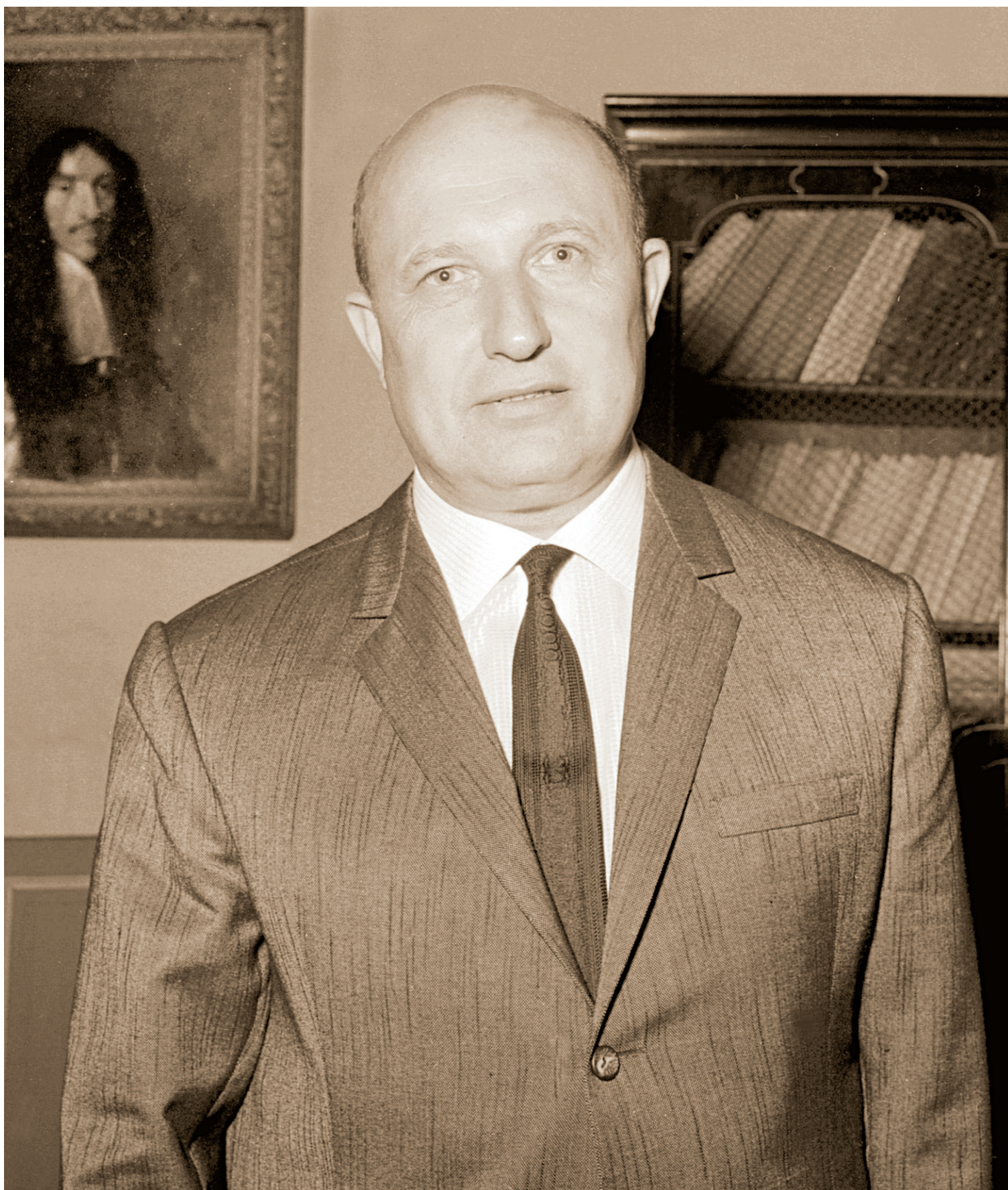
Frédéric Dard (1921-2000) photographié chez lui en 1965

Dès le début, cependant, sont figées quelques règles qui ne changeront plus: San-Antonio s'adresse directement et sans ménagement à ses lecteurs pour les enjoindre de suivre: «Si vous aviez été là, bande de gnoufs, vous auriez pu constater qu'entre moi et la statue de l'ahurissement, il n'y avait pas plus de différence qu'entre un dictateur de droite et un dictateur de gauche.» (Passez-moi la Joconde.) Dès le début aussi, il excelle dans les descriptions de ses fameuses parties de jambes en l'air: «S'il fallait répertorier toutes les frangines transformées par ma flamme en