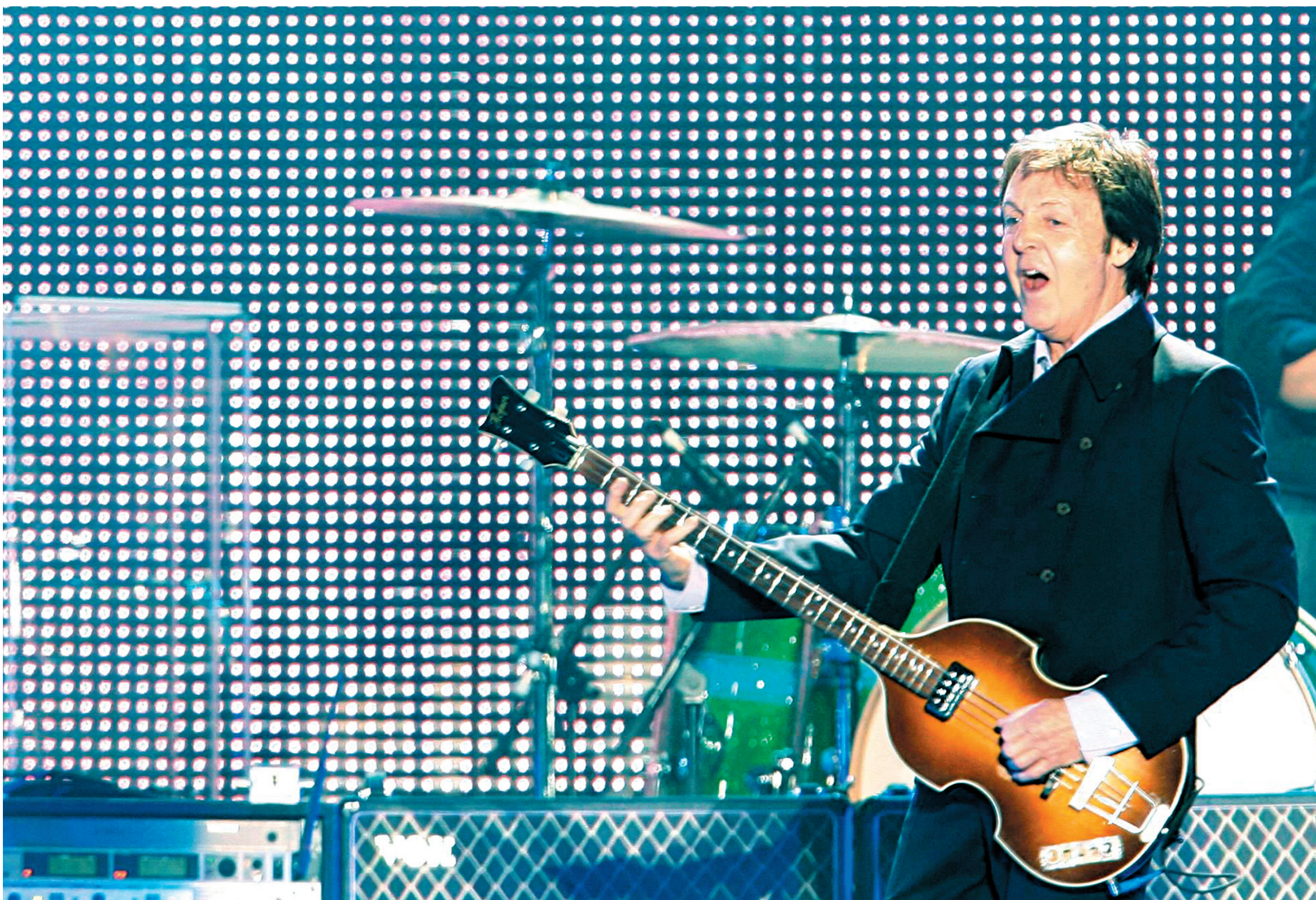
Paul McCartney en spectacle sur les plaines d'Abraham, à Québec, en juillet 2008