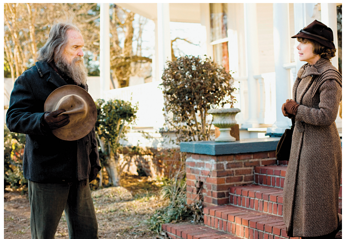
Robert Duvall et Sissy Spacek dans Get Low , d'Aaron Schneider

La tâche d'Adam McKay, qui signe ici son premier long métrage, consiste à faire passer pour du cinéma ce qui n'est en fait qu'un enchaînement télévisuel de sketches de Saturday Night Live auquel on aurait attribué d'urgence un budget exceptionnel pour les poursuites et les explosions. Tout comme Ferrell, McKay est lui-même un ancien scripteur de l'émission humoristique hebdomadaire. Son rapport au cinéma et ses affinités avec le médium restent à peu près aussi abstraites que celles de Patrick Huard ( Filière 13 ). Le hasard ayant voulu que leurs films, sur des sujets voisins, prennent l'affiche en même temps, la comparaison était inévitable. Mais elle est ni à l'avantage de l'un, ni à l'avantage de l'autre.