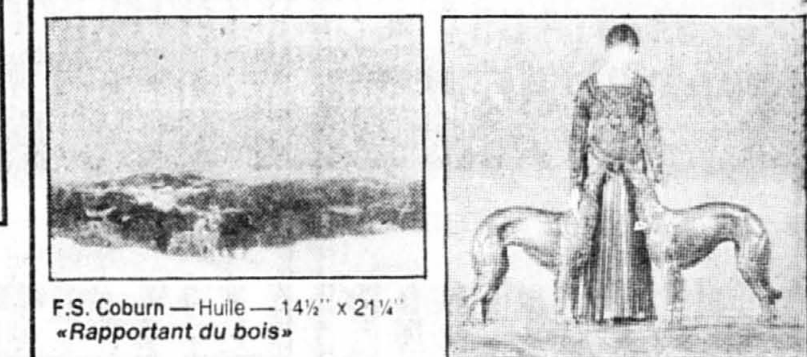
F.S. Coburn — Huile — 14 1/2" x 21 1/4" «Rapportant du bois» Demetre Chiparus — «Les amis de toujours» Bronze et Ivoire — H-22 1/4"

EXPOSITION PRÉLIMINAIRE: Vendredi 7 décembre de 12h à 22h Samedi 8 décembre de 10h à 18h Dimanche 9 décembre de 10h à 18h Lundi 10 décembre de 12h à 22h VENTE Mardi 11 décembre à 19h30 Art canadien et européen sculpture, art nouveau, art Deco Mercredi 12 décembre à 19h30 argenterie Jeudi 13 décembre à 19h30 Mobilier, antiquités et objets de collection Vendredi 14 décembre à 19h30 Mobilier, antiquités et objets de collection Samedi 15 décembre à 13h30 Mobilier, antiquités et objets de collection