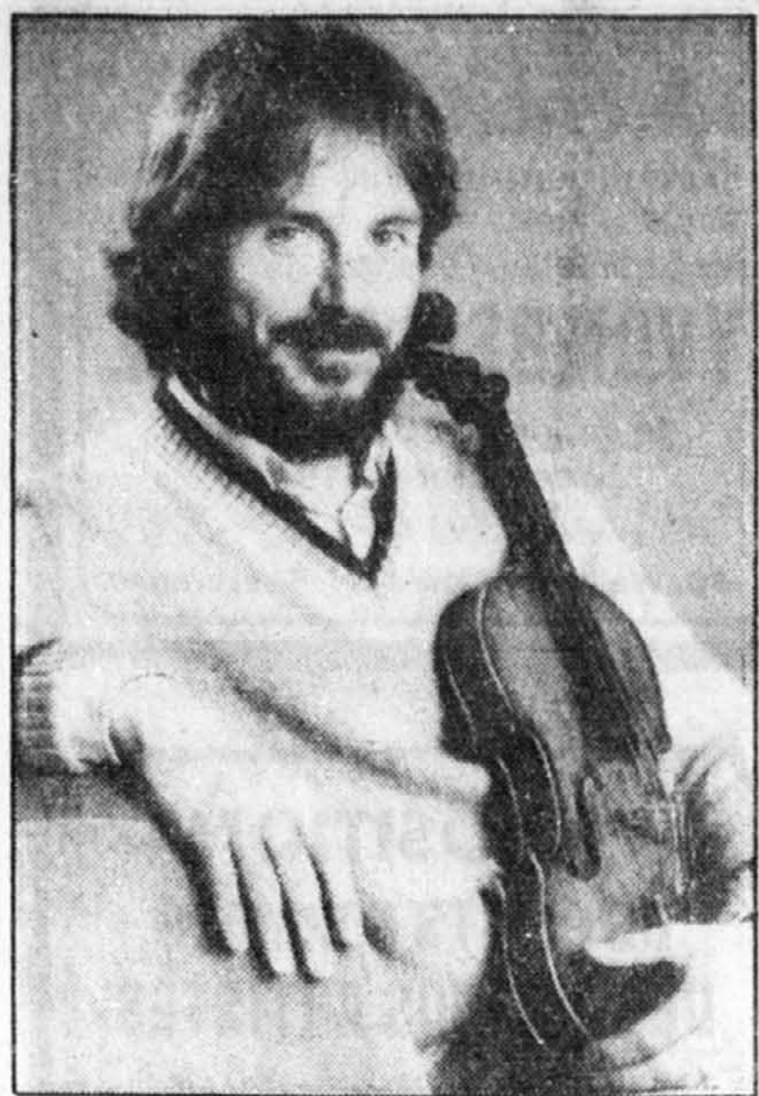
Jean-Luc Ponty. en Californie, et s'intéressant surtout au public américain, Ponty dit créer une musique qui est une synthèse culturelle. Ainsi a-t-il acquis sa rythmique par son expérience américaine, l'instrumentation et l'énergie lui ayant été apportés par le rock.

Déraciné sur le plan culturel, parce que Français vivant