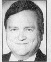
Jean Garon, ex-ministre de l'Éducation.