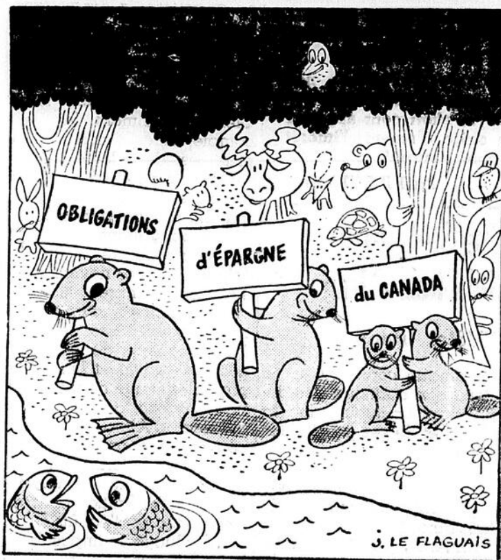
C'est leur nouvelle façon de bâtir.

Cette semaine, plus précisément lundi le 19, a été lancée la huitième émission annuelle des Obligations d'Épargne du Canada. En fait, la campagne de vente bat déjà son plein dans une foule d'usines, de grands magasins et d'autres compagnies où l'on met à la disposition du personnel le moyen d'acheter de ces obligations au moyen de retenues sur le salaire.