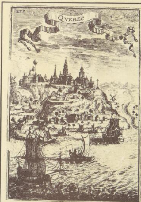
Bibliothèque Nationale du Québec