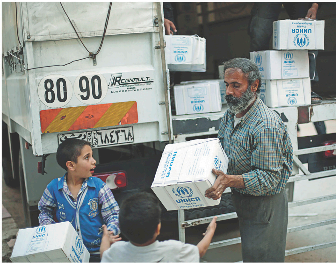
Des Syriens déchargent un convoi d'aide médicale et alimentaire envoyé par le Croissant rouge syrien, à Harasta, dans la banlieue de Damas, en mai dernier.

« Nous avons besoin d'une approbation de l'ensemble du plan de juin pour l'accès à l'aide humanitaire », a déclaré