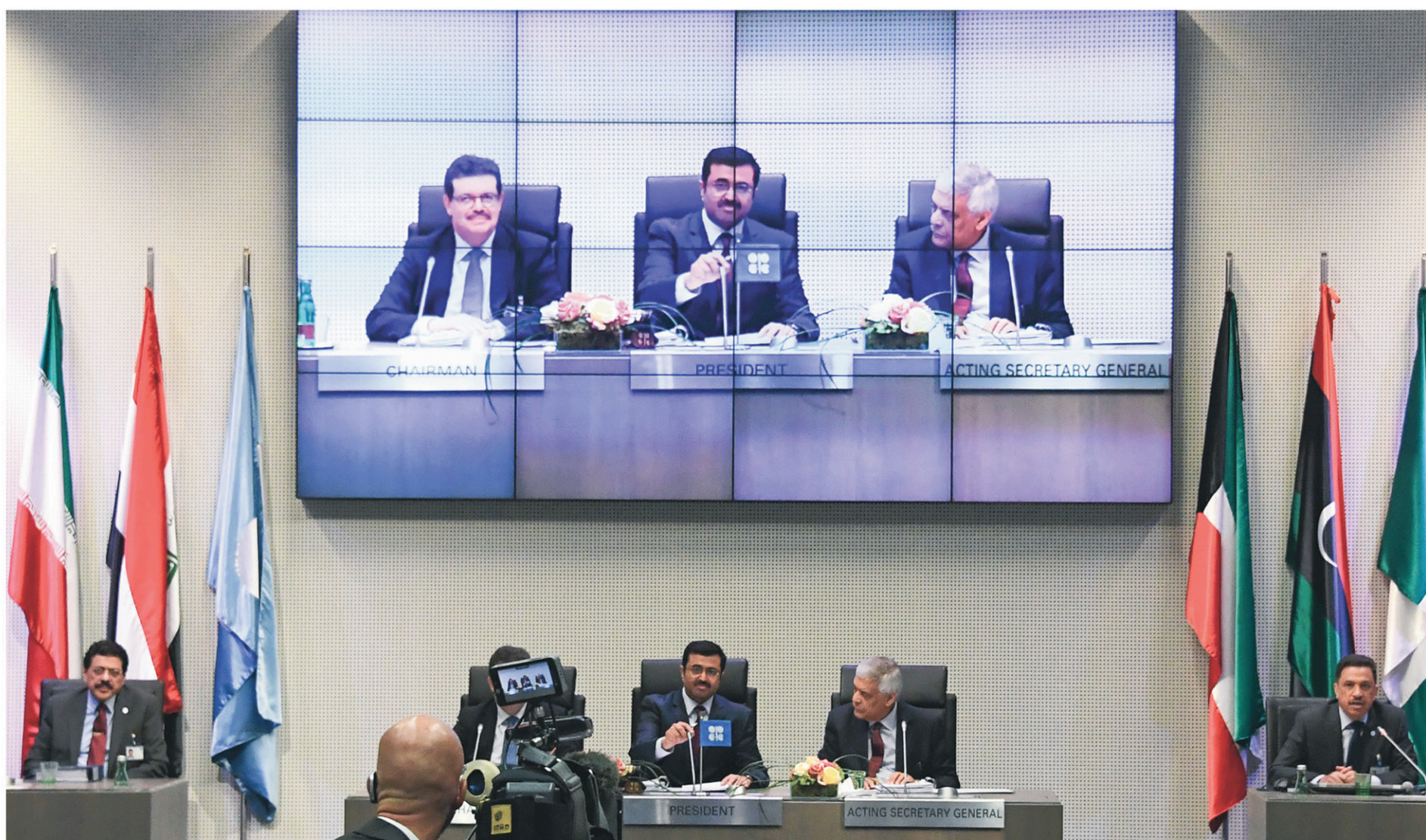
La réunion de l'OPEP, qui se tenait à Vienne, a démontré que les désaccords entre ses membres sont maintenant aplanis.