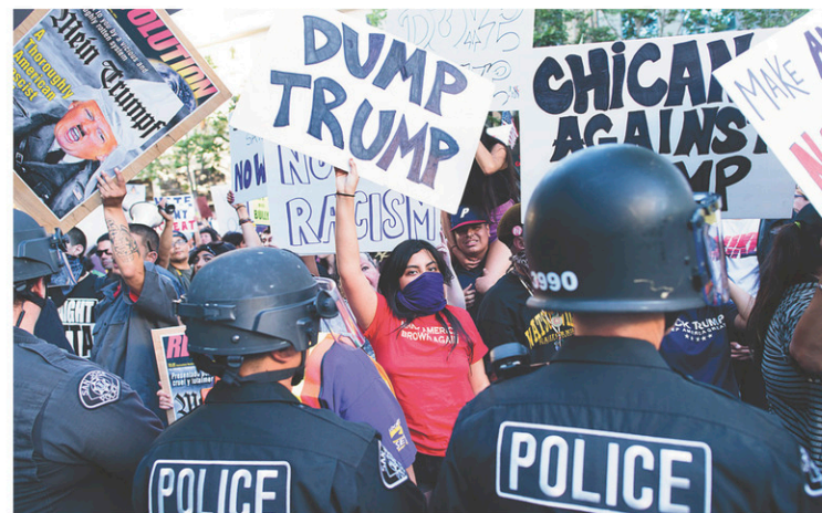
La police encadre des manifestants anti-Trump à l'extérieur du lieu de rassemblement du candidat républicain, jeudi soir, à San José.

« No hate in our state. » (« Pas de haine dans notre État ») et tenaient des pancartes « Dump Trump » (« Débarrassons-nous de Trump »). La police, présente en nombre, a permis aux partisans de Trump d'accéder au rassemblement.