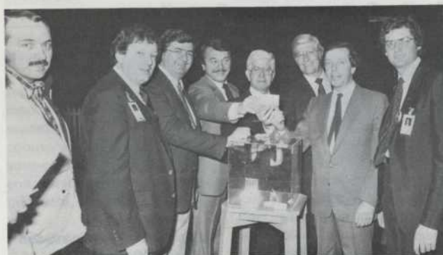
Le sort en est jeté...