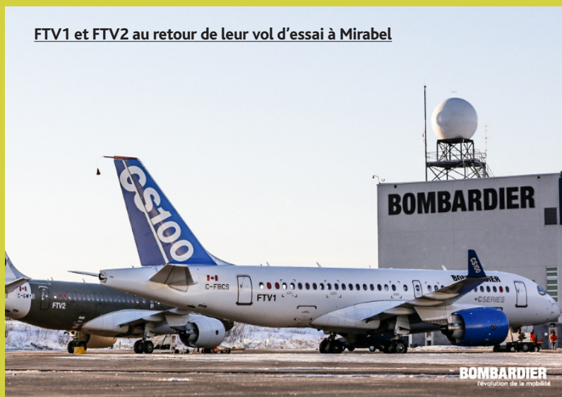
FTV1 et FTV2 au retour de leur vol d'essai à Mirabel

DE L'ENGAGEMENT À L'ACTION Ayant pris son envol le 16 septembre dernier à Mirabel, l'avion CSeries est un exemple frappant des actions concrètes prises par la compagnie en matière de RSE. Il représente également le résultat du travail colossal entrepris par Bombardier afin de construire ses avions différemment. En effet, Bombardier est la première entreprise manufacturière en aéronautique à avoir effectué une analyse de cycle de vie et à avoir mis en place une approche d'écoconception pour un avion complet. L'écoconception vise à intégrer des considérations environnementales à toutes les étapes de cycle de vie du produit, et ce, dès la conception. Quand on sait que 60 à 80 pourcent des incidences environnementales peuvent être déterminées lors de la conception d'un avion, cette approche s'avère cruciale afin de minimiser l'impact de celui-ci sur l'environnement, mais également sur les communautés. En effet, à travers l'approche d'écoconception, Bombardier a réduit de façon significative les émissions de CO 2 et de NO x , ainsi que le bruit de l'avion CSeries. L'approche d'écoconception sera suivie pour tous les nouveaux avions de Bombardier. Cet accomplissement aura un impact positif énorme sur l'environnement et sur les communautés situées en périphérie des aéroports et influencera toute l'industrie de l'aéronautique.