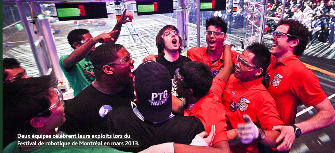
Deux équipes célèbrent leurs exploits lors du Festival de robotique de Montréal en mars 2013.

Ainsi, l'approche de RSE chez Bombardier a un impact plus large que la simple gestion environnementale de ses activités. Cette approche fait partie des leviers stratégiques de la compagnie, tout comme la satisfaction de la clientèle ou encore la gestion des risques. C'est une façon de se comporter en affaires, de poursuivre des activités commerciales, mais de façon responsable. Bombardier a la conviction que la RSE aidera la compagnie à se distinguer et à atteindre ses objectifs dans le futur.