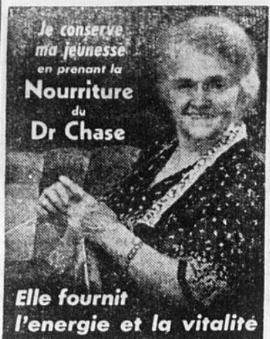
Elle fournit l'énergie et la vitalité