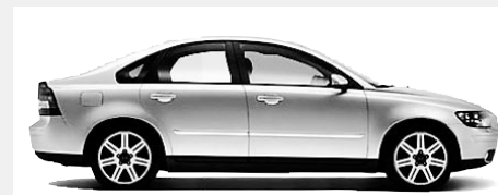
2005 VOLVO S40 2,4 L 5 VITESSES MANUELLES