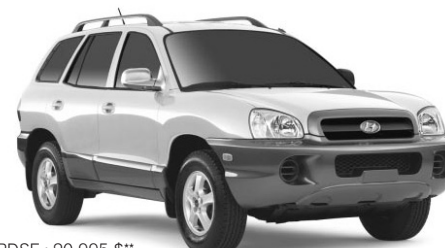
PDSF : 20 995 $**