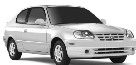
PDSF : 12 995 $**

ASSOCIATION DES JOURNALISTES AUTOMOBILE DU CANADA