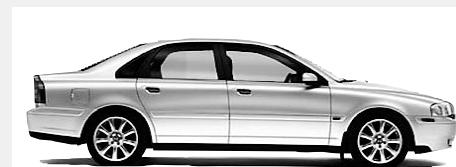
2005 VOLVO S80 4 RM