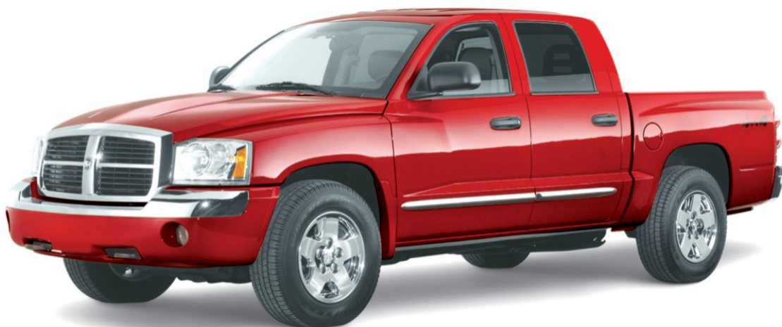
Modèle Dodge Dakota Quad Cab MC 4x4 2005 illustré.