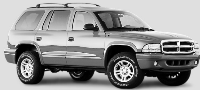
Dodge Durango 2003

morquage du Dodge Durango atteint 3311 kg. Toutefois, ne vous méprenez pas, malgré sa taille moyenne, le Durango consomme autant de carburant que les gros VUS.