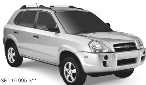
PDSF : 19 995 $**

par mois/60 mois • 2995 $ de comptant. 0 $ de dépôt de sécurité. Transport et préparation inclus.