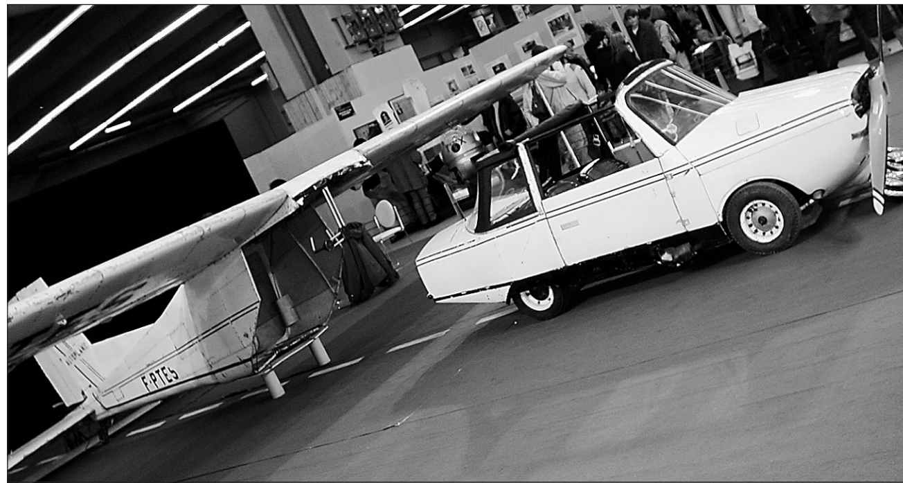
En un quart d'heure d'assemblage, l'Autoplane devenait un avion par l'ajout d'ailes et d'un train d'atterrissage. Arrivé à destination, la partie volante était traînée en remorque.

Les visiteurs ont aussi pu admirer le minivan le plus rapide du monde : un Renault Espace en fibre de