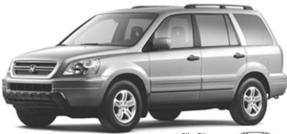
Pilot LX illustré

Incluant 96 000 km • Option 0$ comptant disponible Transport et préparation inclus