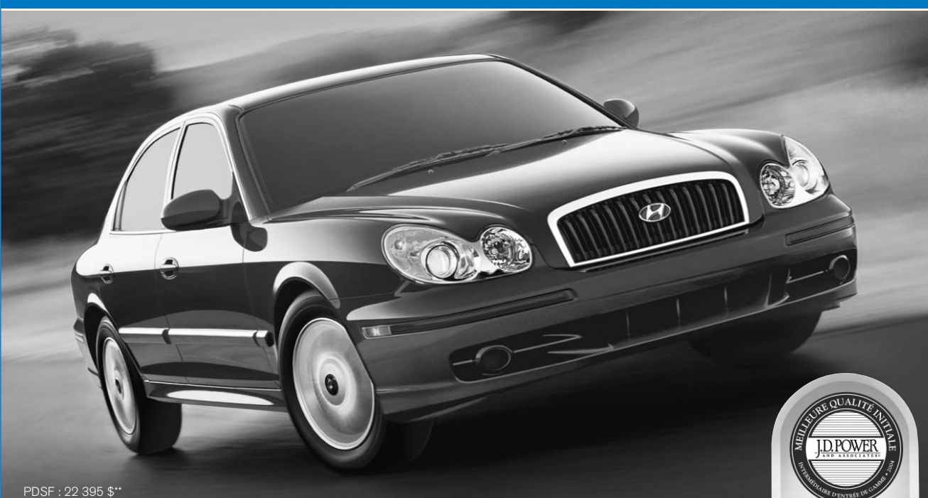
PDSF : 22 395 $**

FINANCEMENT À L'ACHAT DE 0%*, AUCUN PAIEMENT ET AUCUN INTÉRÊT POUR 150 JOURS SUR TOUS LES MODÈLES.**