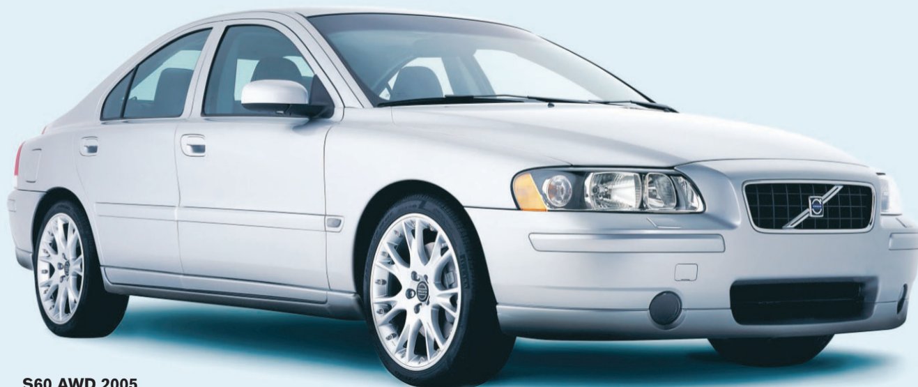
S60 AWD 2005

ÉQUILIBRE ET PERFORMANCES. VOILÀ L'EXTRAORDINAIRE COMBINAISON QUE VOUS OFFRE LA VOLVO S60 À TRACTION INTÉGRALE, AVEC SON MOTEUR TURBO 2,5 LITRES QUI VOUS GARANTIT UN COUPLE OPTIMAL. DE PLUS, LES TOUTES DERNIÈRES TECHNOLOGIES QUE NOUS UTILISONS VOUS ASSURENT D'EXCELLENTE PERFORMANCES ET DES GAZ D'ÉCHAPPEMENT MOINS POLLUANTS. PERFORMANCES, SÉCURITÉ ET DESIGN SONT EN PARFAITE HARMONIE POUR VOUS OFFRIR UNE EXPÉRIENCE AUTOMOBILE SANS PAREILLE. RENDEZ VISITE À VOTRE CONCESSIONNAIRE DE LA RÉGION DE MONTRÉAL POUR FAIRE UN ESSAI ROUTIER DÈS AUJOURD'HUI.