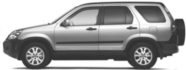
CR-V LX illustré

Incluant 96 000 km • Option 0$ comptant disponible Transport et préparation inclus