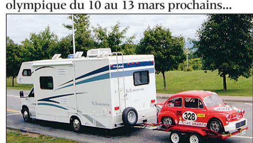
En route pour Lime Rock, Connecticut.