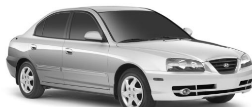
PDSF : 14 995 $**