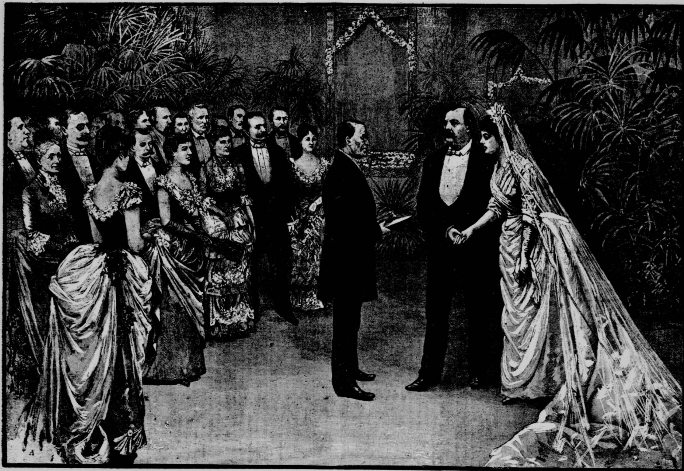
WASHINGTON. — MARIAGE DE GROVER CLEVELAND, PRÉSIDENT DES ÉTATS-UNIS, AVEC Mlle FRANK FOLSOM, A LA MAISON BLANCHE