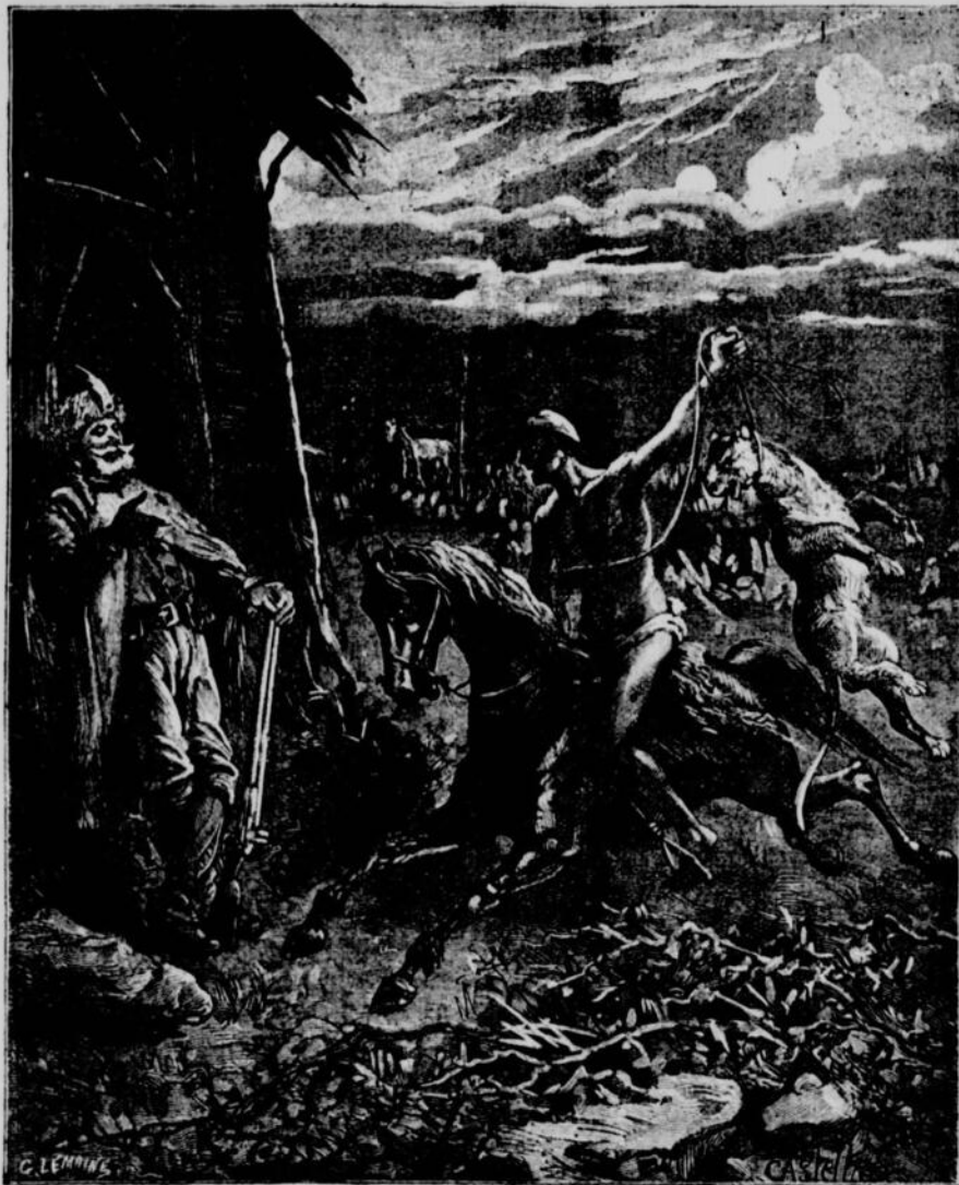
Le gaucho enleva la bête au lasso.—(Page 54, col. 2).

Maintenant que nos lecteurs connaissent les principaux personnages qui figureront dans notre