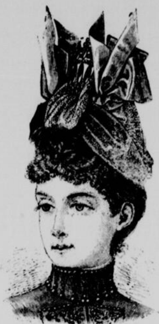
CAPOTE EN DENTELLE FICELLE