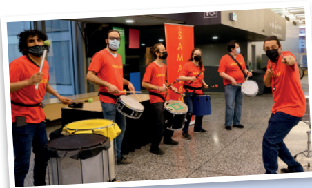
C'est SAMAJAM qui a accueilli les membres au premier matin du colloque. Dynamique et entraînant !