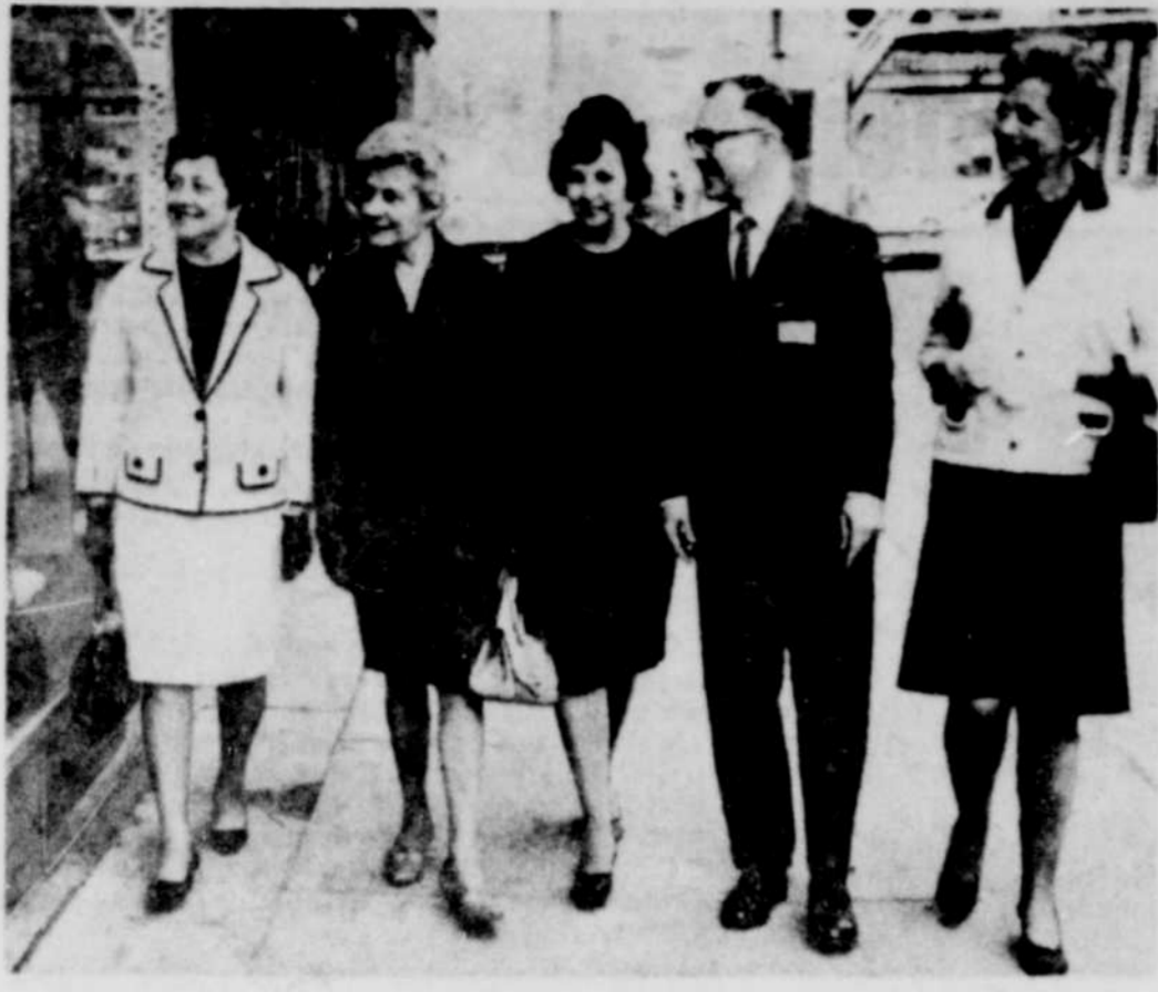
CETTE PHOTO a été prise sur la rue principale à Welland, lors de la visite de la délégation de Sorel, Saint-Joseph et Tracy, dans cette ville, qui est jumelée à celle de Sorel depuis 1957. Le trésorier