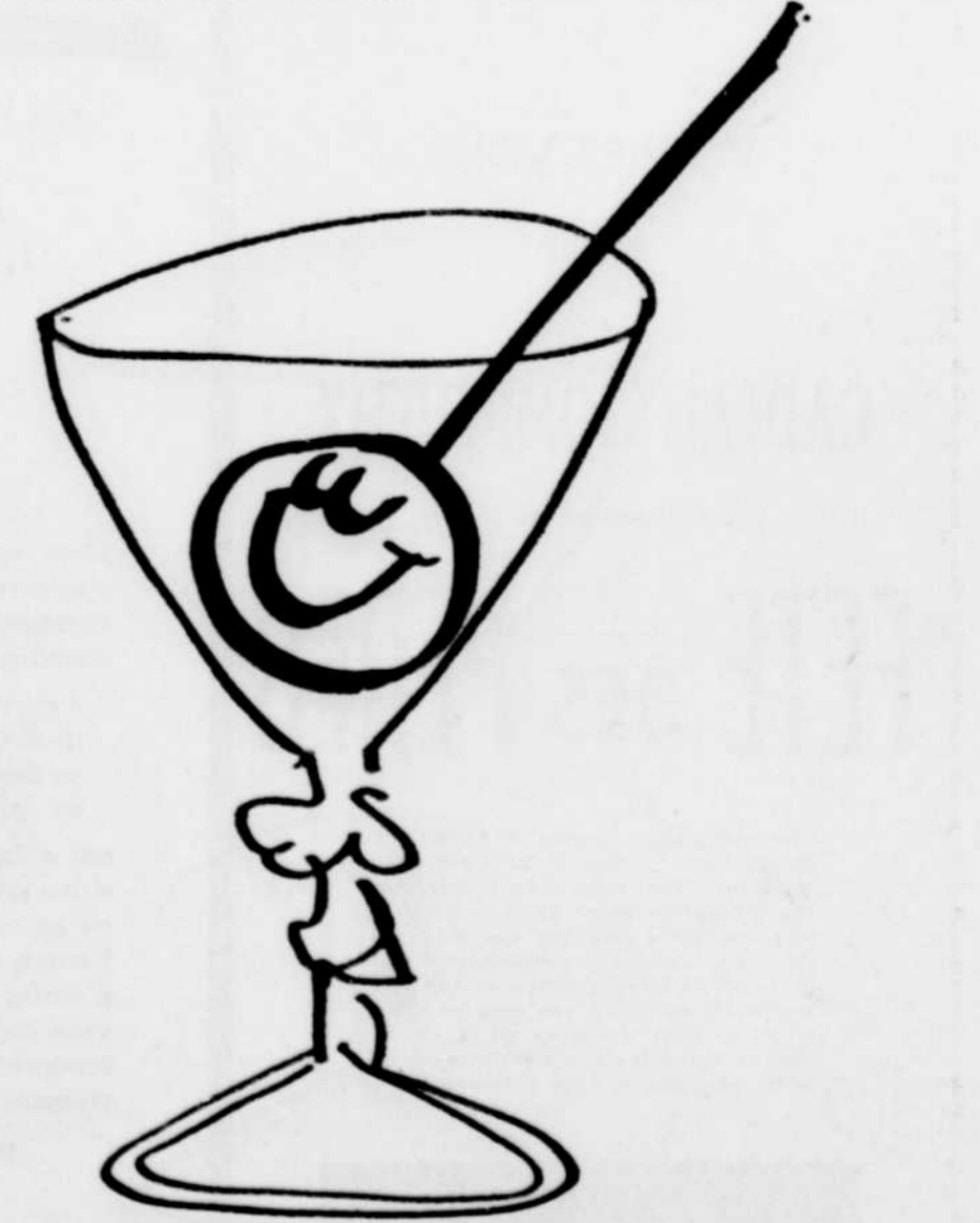
"Le rêve de ma vie! Finir dans un martini au gin Gordon."