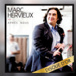
Album en magasin

billets : evenko.ca billetterie du Centre Bell 514 790-2525 / 1 877 668-8269