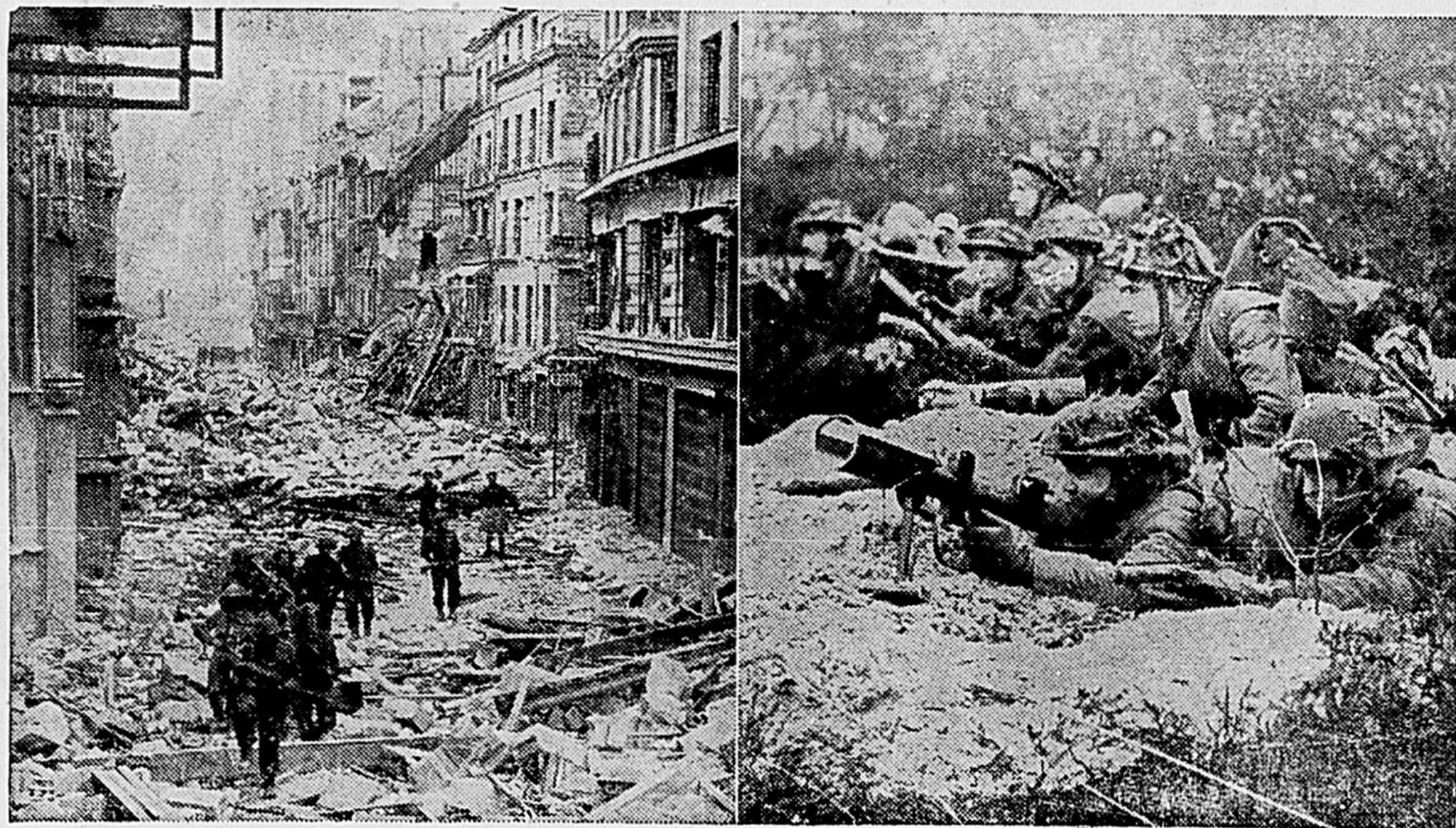
Dans les rues jonchées de débris, à Caen, ou dans les trous de tirailleurs remplis d'eau, en Hollande, les fantassins canadiens ont poursuivi résolument leur oeuvre. Le film "The True Glory" nous donne un aperçu de la guerre en Europe depuis le jour de l'invasion jusqu'au jour VE. Aucune difficulté n'a entravé l'avance des Canadiens qui n'avaient qu'un but: détruire l'ennemi. A gauche, ci-dessus, une patrouille canadienne avance prudemment dans les ruines de Caen, à la recherche de canardeurs ennemis. A droite, une section canadienne armée de Piats et de mortiers attend l'ordre de franchir la frontière hollandaise afin d'envahir le territoire allemand.