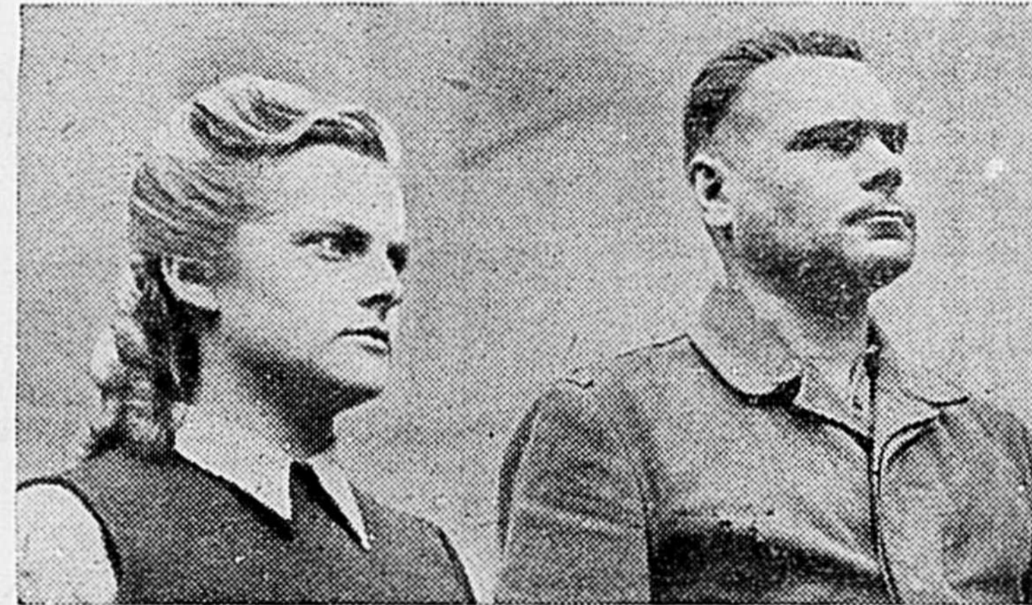
Irma Grese, qui avait charge des "chambres de mort", et Joseph Dramer, "le bourreau de Belsen", photographiés dans la cour de la prison de Celle, avant leur procès. (Photo publiée en août 1945).