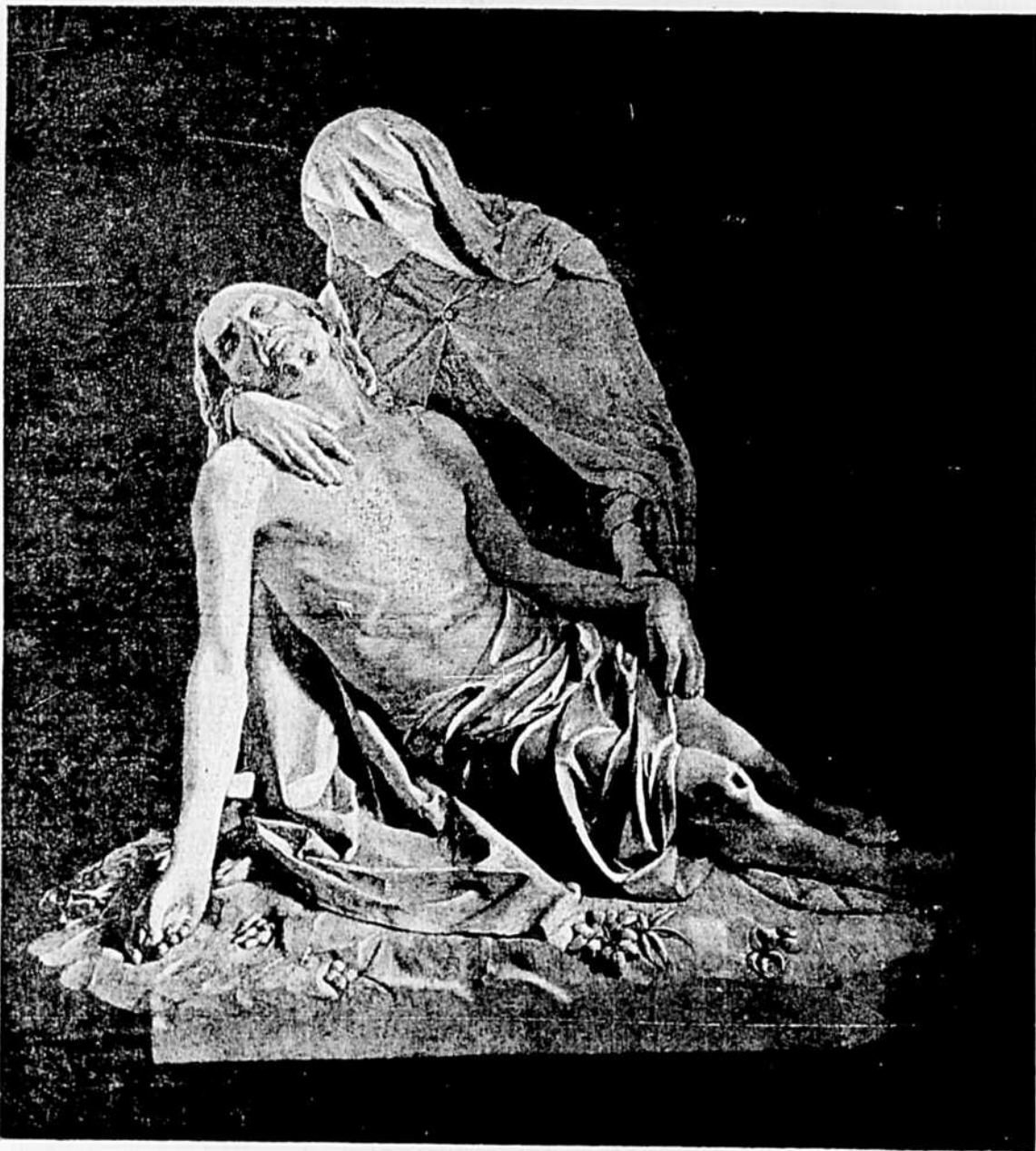
NOTRE-DAME DE PITIÉ.