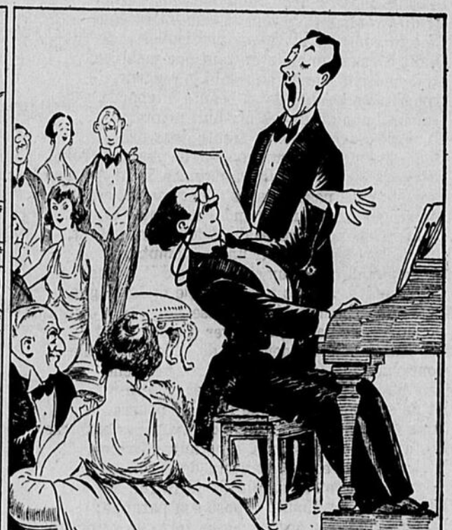
ET TU TE LANCES AVEC UNE BELLE ARDEUR, CONSCIENT QUE TOUS LES REGARDS SONT PORTÉS VERS TOI-