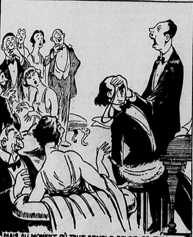
MAIS AU MOMENT OÙ TOUT SEMBLE DEVOIR SE TERMINER À TON HONNEUR... PATATRASI TU RATES COMPLÈTEMENT LA DERNIÈRE NOTE-