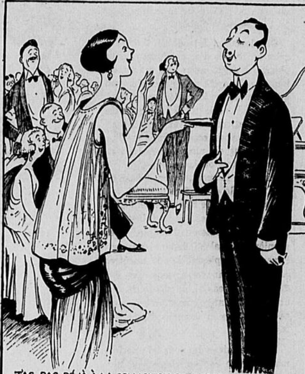
T'AS-PAS DÉJÀ LA SOLLICITATION PRESSANTE D'UNE JEUNE BEAUTÉ, CONSENTI À CHANTER QUELQUE CHOSE POUR SES INVITÉS-