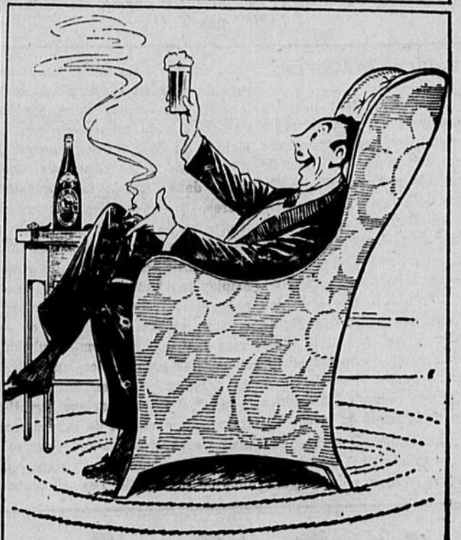
T'AS-PAS ALORS ESSAYÉ UNE BLACK HORSE? C'EST AINSI ÇA QU'UN CANAYEN SE SENT BIEN DANS LA NOTE.