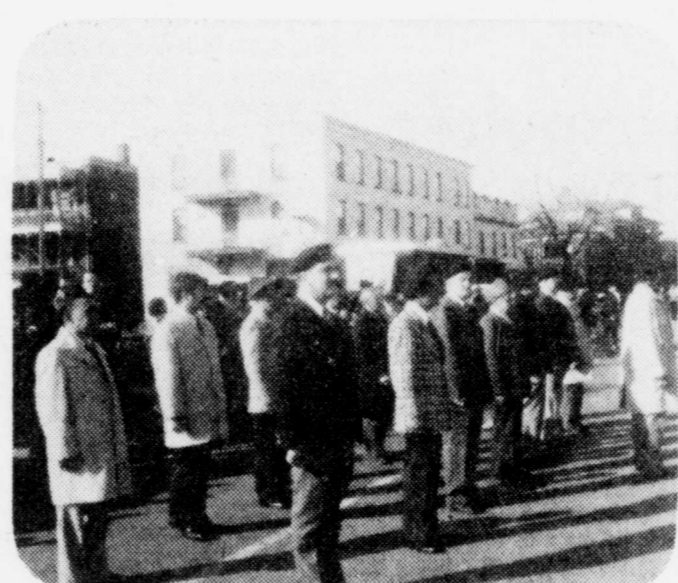
Lors de la cérémonie au Cénotaphe, dans le centre-ville de Victoriaville, on s'est souvenu hier matin des Vétérans morts aux guerres de 1914-18, et 1939-45. Cette photo nous fait voir quelques Vétérans de la dernière guerre.