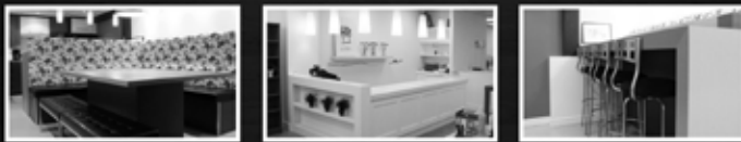
Armoires de cuisine • Armoires de Salle de bain • Projet sur mesure

987, chemin Saint-Thomas • Saint-Étienne-des-Grès (Qc)