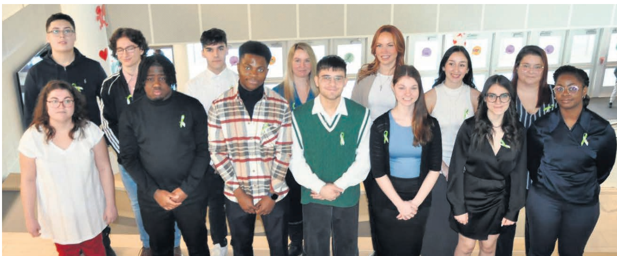
Les 15 ambassadeurs de la persévérance scolaire de la MRC Les Moulins ont été honorés ce 14 février lors d'un gala tenu à l'école secondaire du Havre à Terrebonne.