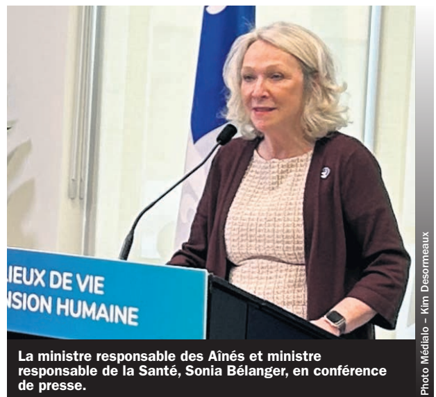
La ministre responsable des Aînés et ministre responsable de la Santé, Sonia Bélanger, en conférence de presse.

Depuis 2022, la maison des aînés de Mascouche était en construction. Des délais de construction ont été engendrés ce qui a retardé l'arrivée des premiers résidents.