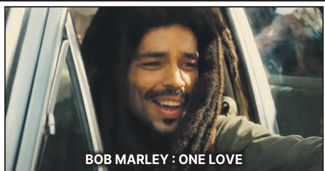
BOB MARLEY : ONE LOVE