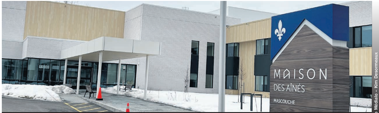
La maison des aînés de Mascouche a accueilli ses premiers résidents.

Bien que les résidents de la nouvelle maison pour aînés soient des personnes en perte d'autonomie, la mission première est de leur permettre d'être autonomes le plus longtemps possible. «Des lève-personnes sont installés dans chacune des chambres pour permettre aux résidents