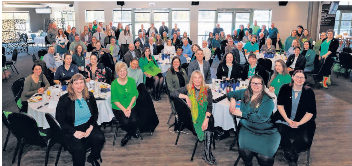
Les élus et les délégués de la réussite éducative des différents milieux municipaux lanaudois se sont réunis dans le cadre du Déjeuner des municipalités engagées organisé par le CREVALE le 15 février dernier.