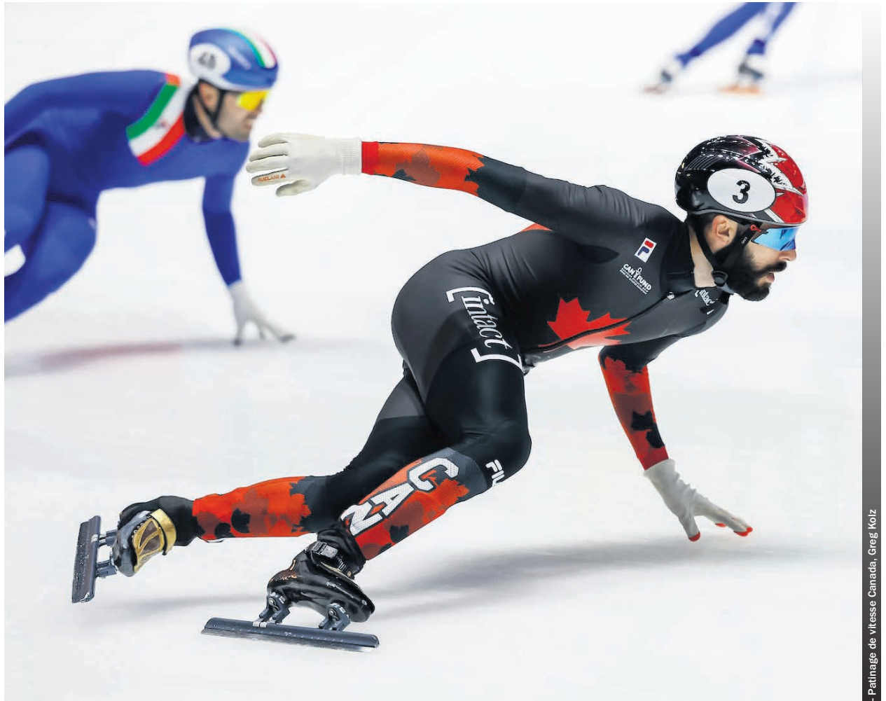
Steven Dubois, plus tôt cette saison, à la Coupe du monde de Montréal.

En finale du relais, les éventuels vainqueurs ont augmenté le rythme en fin d'épreuve pour conserver la tête pendant que derrière, Japonais et Sud-Coréens bataillaient pour la deuxième place. Une fois cette lutte terminée, les représentants de la Corée du Sud ont fait