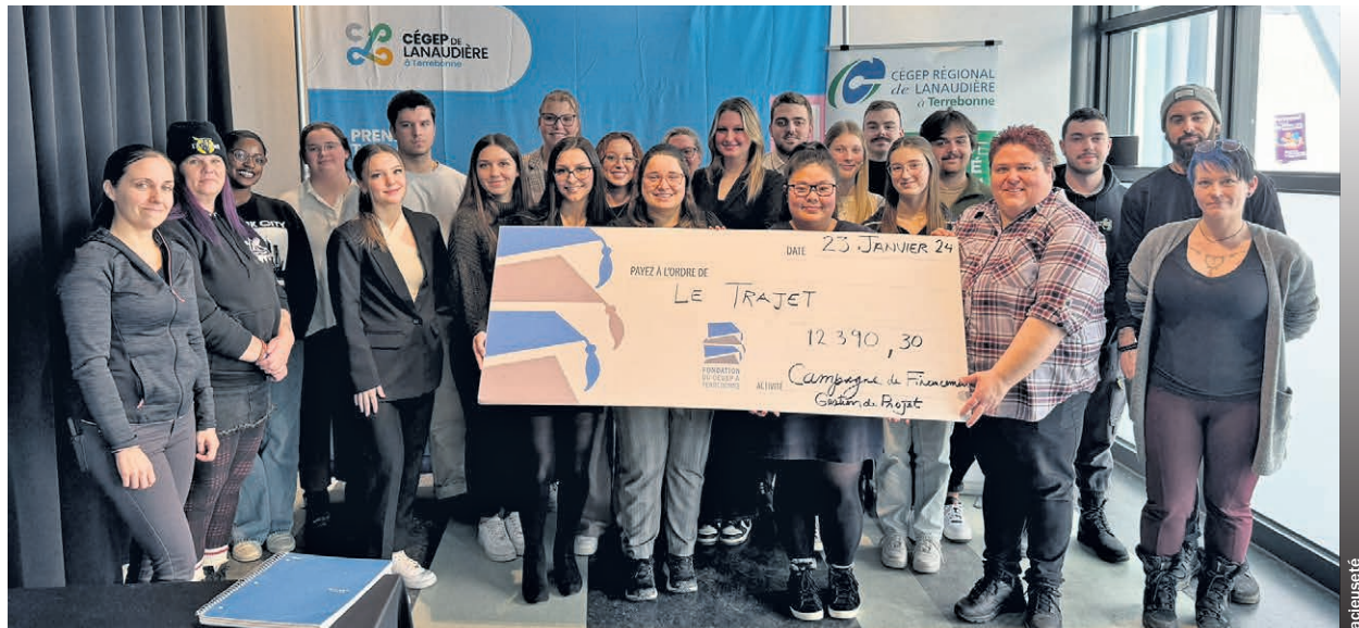
Les étudiants ayant participé au projet remettent fièrement un chèque aux représentants de l'organisme Travail de rue Le TRAJET.

« Je trouve très intéressant et formateur qu'un groupe de jeunes qui étudient en comptabilité et gestion choisissent