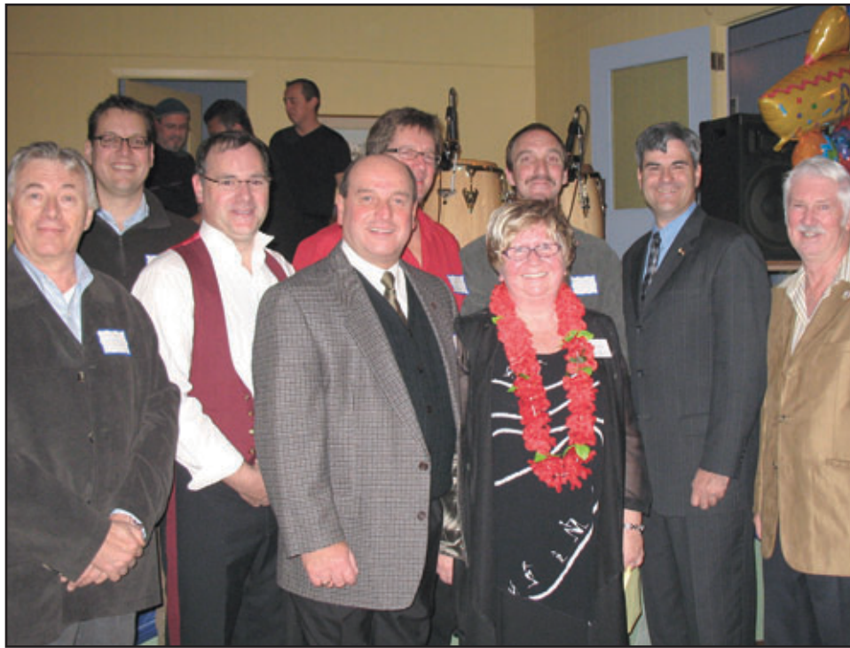
Les membres de la Table de concertation, présents lors de l'événement, sont heureux du résultat de la soirée Latino.