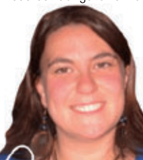
Greffière adjointe - Service du greffe

Pour de plus amples informations sur vos obligations de propriétaires d'animaux domestiques, veuillez communiquer avec le Service du greffe Bonne période automnale avec nos amis les animaux!!!