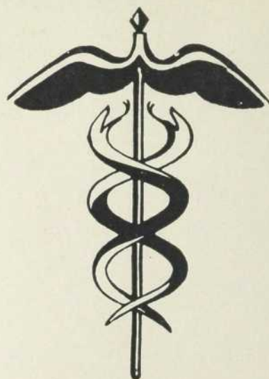
Dictionnaire Marabout de la médecine Tome 2