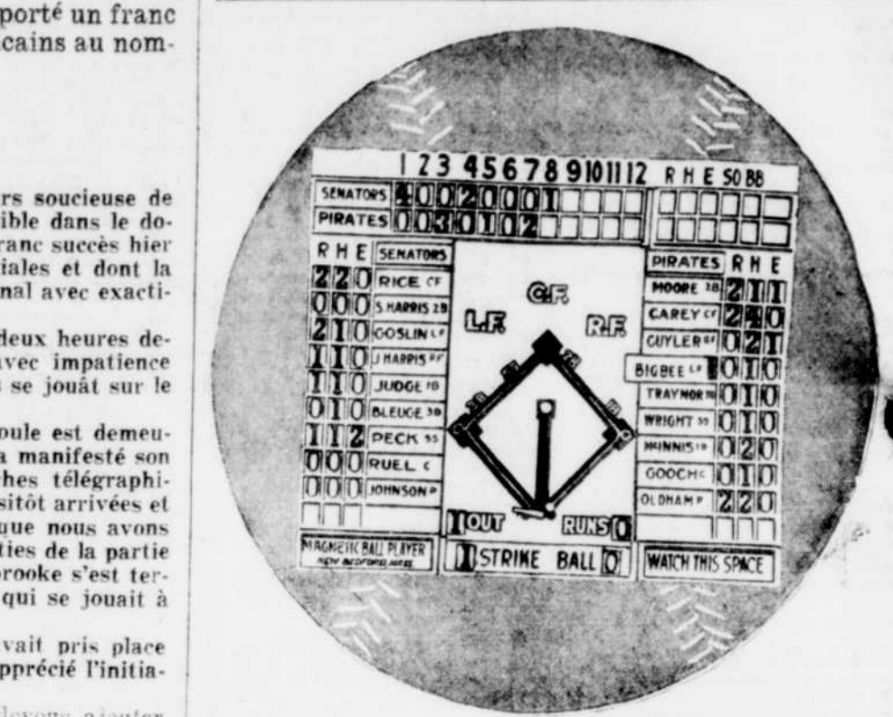
Vues du tableau sur lequel sont reproduites les séries mondiales de baseball à la "Tribune".