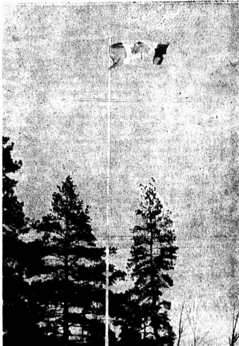
. . . ET AU MAT DE LA GREAT LAKES