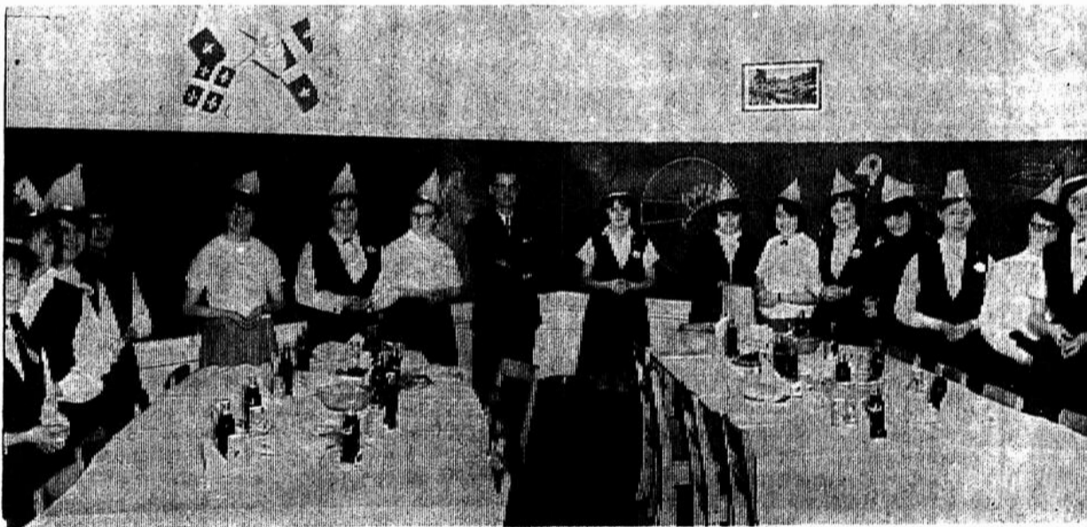
REPAS COMMUNAUTAIRE A L'ECOLE SECONDAIRE C.N.D. — Jeudi, le 11 février, à l'heure du dîner, les classes sont transformées en réfectoires. Dans le cadre des activités de la

B) Comme citoyens : En général, on affirme que l'étudiant est respectueux des règlements établis, mais il y a certaines déficiences qui devront être corrigées au fur et à mesure de l'affirmation de l'étudiant comme citoyen.