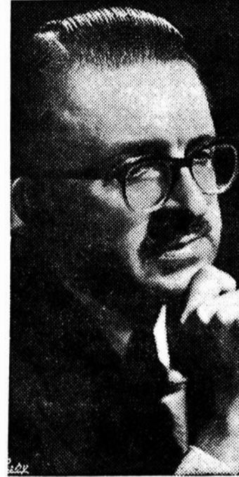
par André LA RIVIERE

NOUS POURSUIVONS LE TOME XIV SUR L'INQUIÉTUDE.