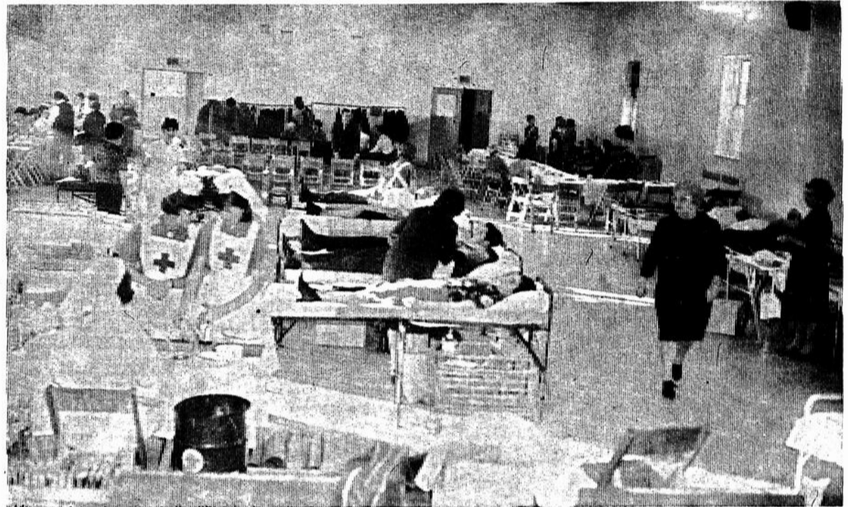
Vers 3 hres de l'après-midi, mardi dernier, le seul moment tranquille de la journée notre photographe fait sa visite à la