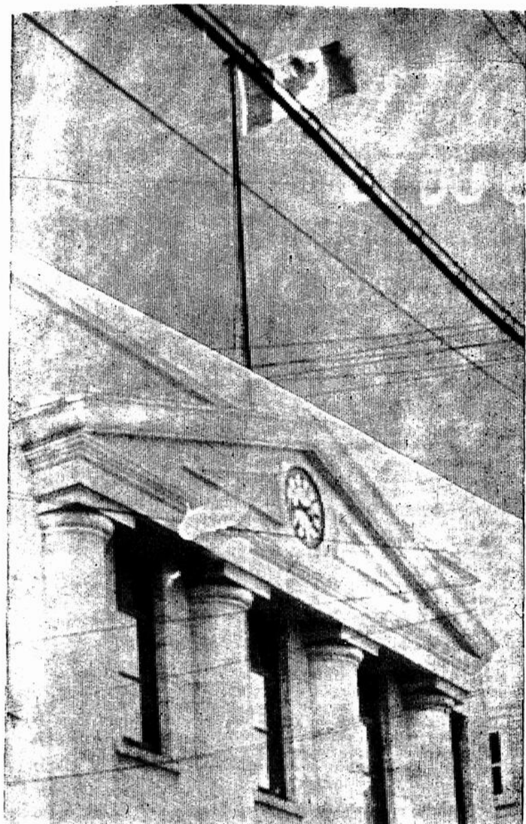
FLOTTE SUR LES EDIFICES PUBLICS BERTHELAIS . . .