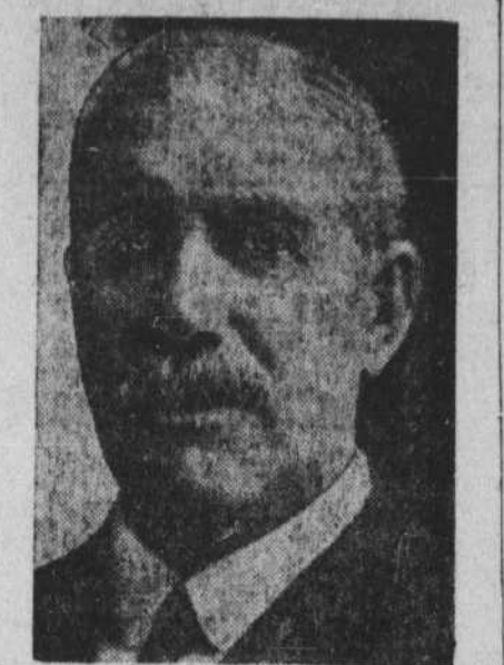
Feu le sénateur ROBERT FORKE — Ancien chef progressiste et ancien ministre de l'immigration et de la colonisation dans le cabinet King, M. Forke est mort le 2 février à 73 ans.

Nouveauté canadienne Fils de Québec par PIERRE-GEORGES ROY