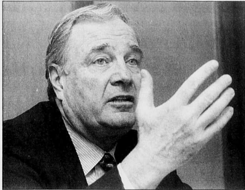
Le ministre des Finances du Canada, Paul Martin