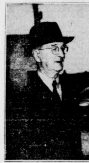
Deux vétérans de la politique libérale, toujours actifs, photographiés hier, au congrès de l'Union, sénateur Jacob Nicol, ex- C. I. de Sherbrooke, et l'hon. Brooke Claxton, ministre de la Défense nationale dans le cabinet St-Laurent.

Le Congrès national de son parti, qui se tiendra à Ottawa, sera l'occasion de présenter son programme et de discuter des questions nationales. Le parti libéral a une stratégie claire et une vision de l'avenir du Canada.