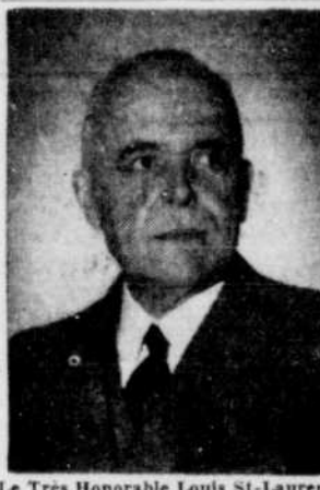
Le Très Honorable Louis St-Laurent Travail accompli Le premier point de ce programme était la législation relative à l'entrée de Terre-Neuve dans la confédération. (A suivre en page 5)