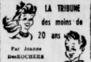
LA TRIBUNE des moins de 20 ans

Le 24 mai inaugure officiellement le temps des pique-niques et des pique-niques de mention de ces deux choses parce qu'une personne qui possède une villa croit habituellement que c'est le début de l'été, que la température l'indique ou non. Si elle ne possède pas de chalet, plus d'une famille fait sa première excursion ce jour-là, à son endroit de pique-nique préféré... et la température s'y prête, naturellement.