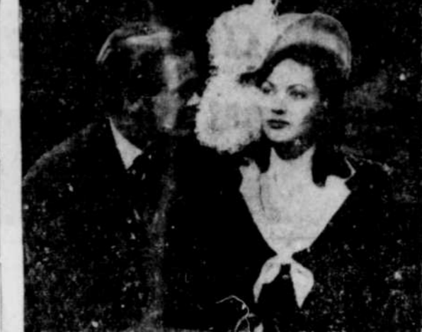
Yvonne De Carlo de Dan Duryea dans une scène du film "BLACK BART", à l'affiche du Premier à partir de mercredi, en programme double avec un film présenté en premier à Sherbrooke, "THE BIG FIX".