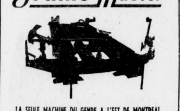
LA SEULE MACHINE DU GENRE A L'EST DE MONTREAL

Après un accident... Faites réparer ou vérifier le châssis de votre auto ou camion sur notre "Frame Master"