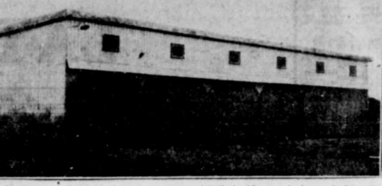
Hangars municipaux - Voici les hangars municipaux gagnés par la ville de Magog, situés rue St-Luc. Ces hangars, faits d'aluminium, serviront à abriter la machinerie.

8.-Je ne te demande ni tes opinions, ni ta religion, mais qu'elle est ta souffrance? PASTEUR