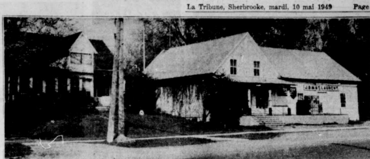
Au centre du coquet village de Compton, situé à une quinzaine de milles de Sherbrooke, se dresse une maison blanche et un magasin général qui passeront sans doute à l'histoire. C'est là qu'est né le premier ministre, le t. h. Louis St-Laurent, dans cette demeure vieille de trois quarts de siècle. C'est là qu'il a grandi, qu'il a travaillé au ma-

M. J. Edmond Lemieux, industriel de Windsor, qui avait annoncé qu'il serait candidat au prochain congrès du parti conservateur dans la circonscription de Windsor-Compton, a déclaré qu'il ne le fera pas.