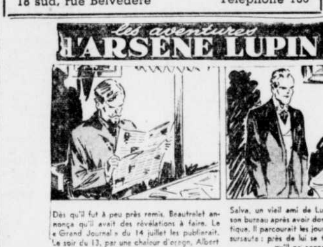
Dès qu'il fut à peu près remis, Beaufort annonça qu'il avait des révélations à faire. Le "Grand Journal" du 14 juillet le publiait. Le soir du 13, par une chaleur d'été, Albert Salva, un vieil ami de Lupin, était installé dans son bureau après avoir donné congé à son domestique. Il parcourait les journaux quand, soudain, il sursauta: près de lui se tenait un homme jeune qu'il ne connaissait pas.