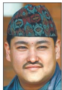
Le prince Dipendra

celle d'autres dirigeants népalais, qui ont annoncé samedi que le prince héritier Dipendra, âgé de 29 ans, avait tué ses proches et blessé trois autres personnes à la suite d'une violente dispute relative à ses projets de mariage.