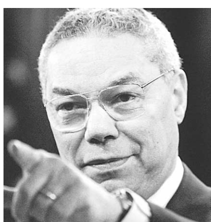
Colin Powell, secrétaire d'État des États-Unis

En avril, M. Powell avait, lui, déclaré à Paris que l'administration américaine avait l'intention de rester engagée dans les Balkans.