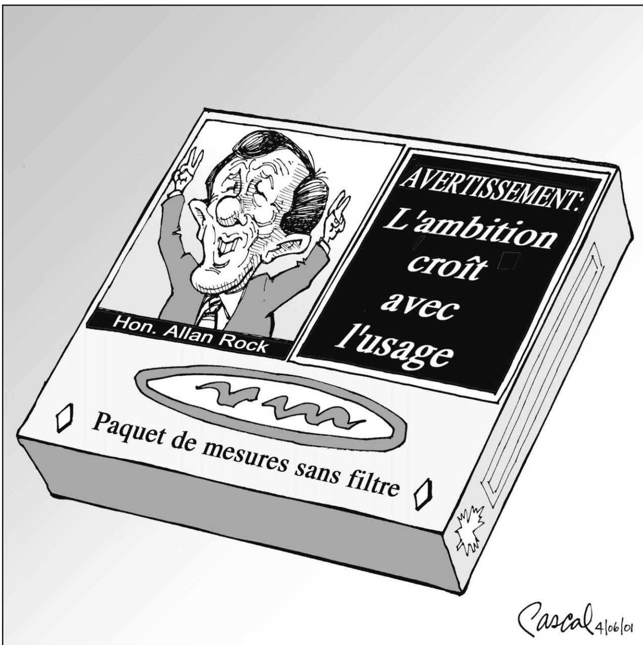
Pascal Élie, collaboration spéciale

Pendant ce temps, les chefs d'États européens n'ont pas peur d'exprimer leurs divergences et de mettre les sujets les plus délicats sur la table. Et curieusement, cela n'a pas empêché l'Europe d'avancer.