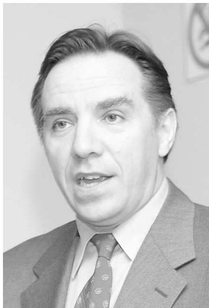
© François Legault