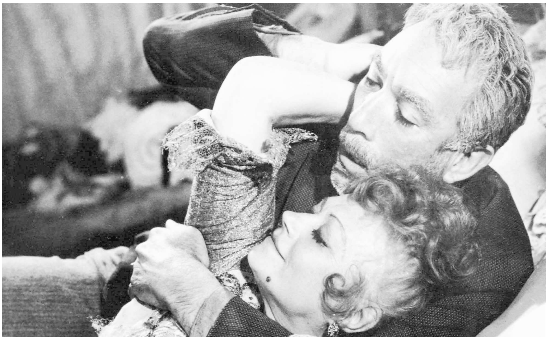
Son incarnation d'un patron d'un cirque miteux dans La Strada de Federico Fellini (1954) a contribué à faire de l'Américain Anthony Quinn un important acteur international.

Né au Mexique et élevé dans la pauvreté à Los Angeles, Anthony Quinn commence par faire de la figuration dans des films dits de « série B » avant de devenir un important acteur international. Reconnu pour sa grande sensibilité, il a joué pour les plus grands réalisateurs des deux côtés de l'Atlantique. La Strada de Federico Fellini (1954) où il donne corps au « patron » d'un cirque miteux dont la seule richesse est le clown incarné par Giulietta Masina, a contribué à sa renommée en Europe.