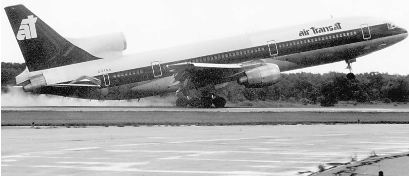
Un appareil du transporteur montréalais Air Transat.

Transat mais plutôt des fonctionnaires cubains, « revendent » illégalement des sièges déjà réservés. Notre entreprise, comme les