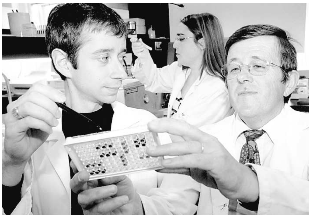
« Les pharmaciens communautaires sont des professionnels qui rendent des services de santé et qui ont des obligations financières. Rendre service à un patient est une chose, assumer les frais d'une décision qui n'arrive pas en est une autre », pense l'auteur de ce texte.

Au total, l'article de Claude Gingras est un anti-modèle de critique.