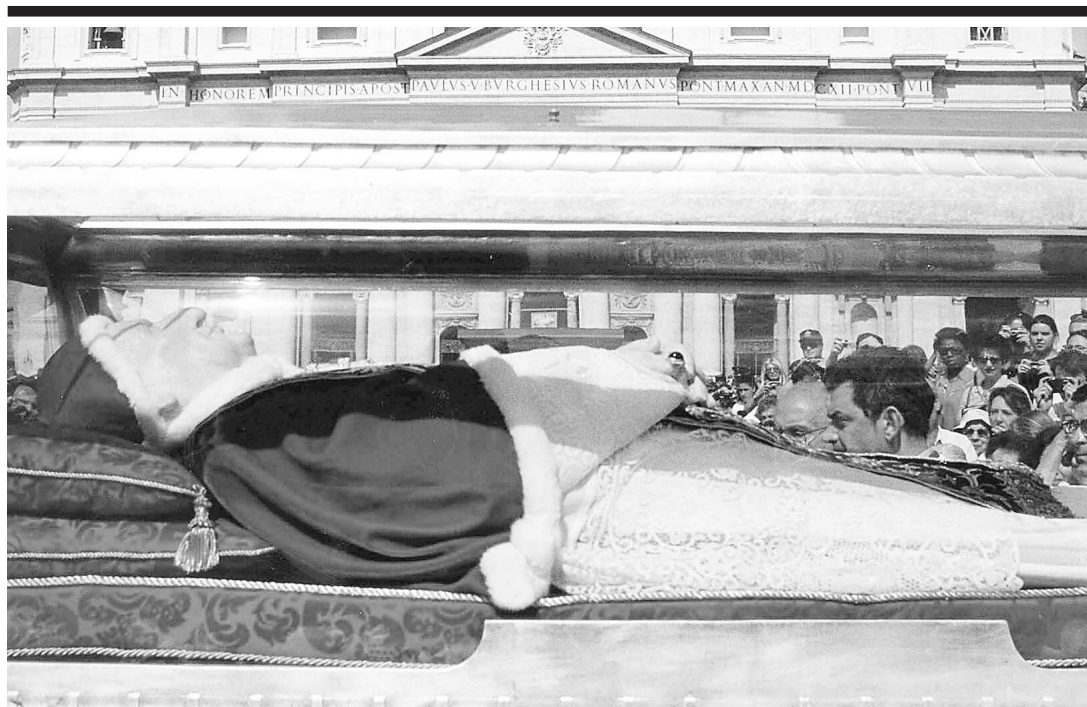
La place Saint-Pierre a attiré, hier, des milliers de fidèles venus voir le corps embaumé du pape Jean XXIII.

Le gouvernement, qui demande actuellement aux organismes concernés de lui soumettre des avis relativement au projet de politique, promet de finaliser sa position au plus tard en décembre.