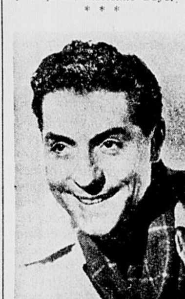
Jacques Pills, célèbre chanteur fantaisiste français, qui figurera aux spectacles de variétés que présentera Lucienne Boyer au Plateau du 26 au 30 novembre. L'Orchestre sera dirigé par Frank Pourcel.

On constatera une fois de plus que pour goûter pleinement l'art des nuances, le sens du dramatique chez Lucienne Boyer, il faut vraiment la voir aussi bien que l'entendre. On l'a imitée, on l'a copiée de toutes parts, mais il n'y a qu'une Lucienne Boyer.