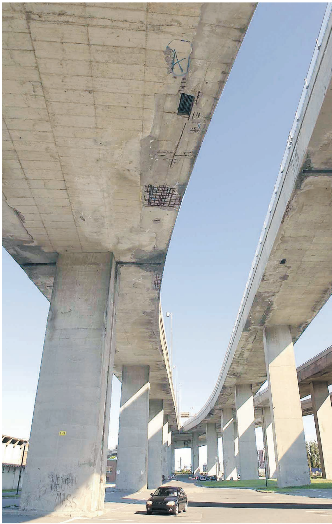
Ces deux bretelles voisines de l'échangeur Turcot, qui surplombent le stationnement d'un centre sportif de la Ville de Montréal, montrent des signes de décrépitude et d'effritement évidents qui ne sont signalés nulle part au ras du sol à l'attention des usagers de l'endroit.