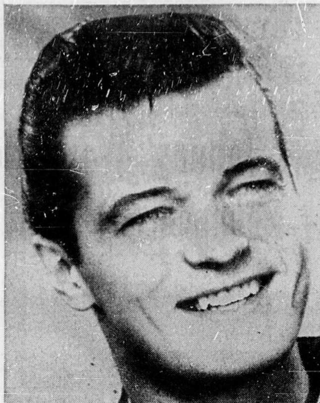
BOB GOULET, que l'on a vu la semaine dernière comme acteur à "GM Presents", nous reviendra à l'écran, jeudi soir, le 15 octobre, en tant que chanteur. Il passera à 8 h. 30 à CBOT, à "L'Heure Wayne et Shuster".