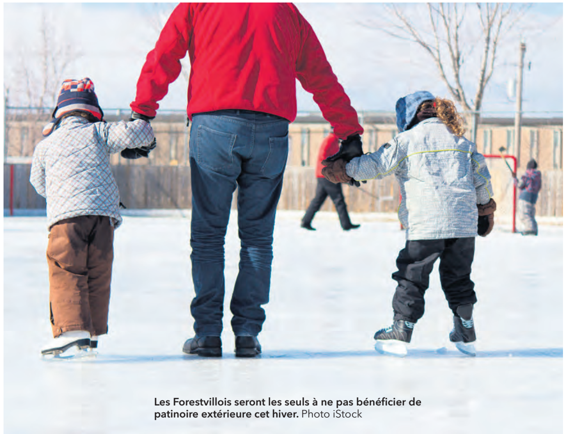
Les Forestvillois seront les seuls à ne pas bénéficier de patinoire extérieure cet hiver.

La communauté innue d'Essipit propose également une patinoire extérieure durant l'hiver. Cette dernière est entretenue par un employé de la Première Nation et elle ouvrira ses portes dès que les conditions météorologiques seront favorables à la fabrication de la surface glacée.