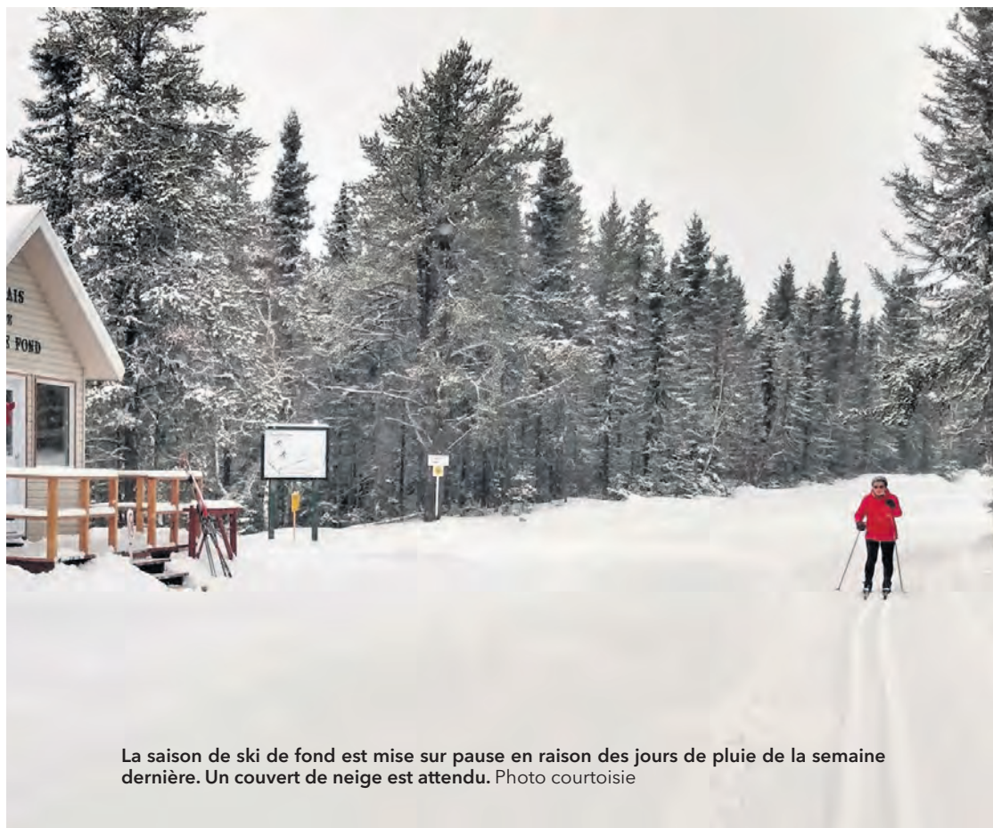
La saison de ski de fond est mise sur pause en raison des jours de pluie de la semaine dernière. Un couvert de neige est attendu.

En nouveauté cette année, l'organisme peut compter sur l'aide du Club de moto-