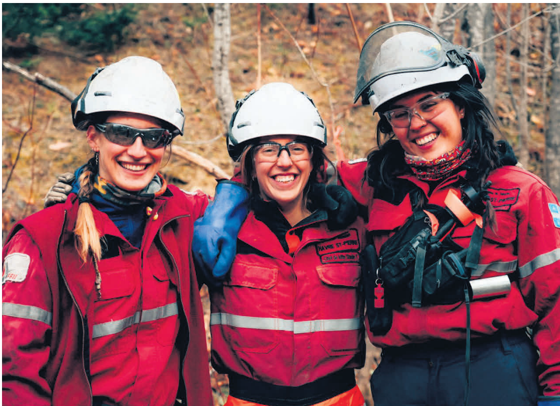
La proportion de femmes embauchées comme pompières forestières tend à augmenter.

La Société de protection des forêts contre le feu (SOPFEU) veut être proactive et éviter de faire face à une pénurie de pompiers forestiers. Elle recrute donc partout en province et la Côte-Nord n'y fait pas exception.