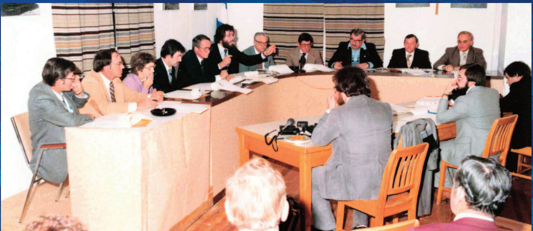
Première séance ordinaire du conseil tenue le mardi 12 janvier 1982 à l'Hôtel de ville des Escoumins.