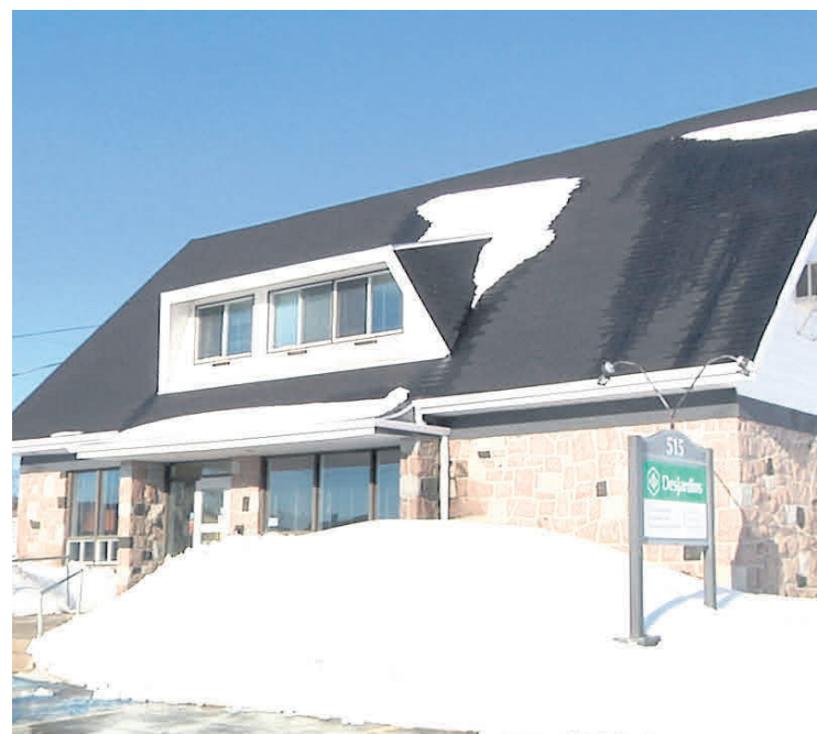
La fermeture du point de service de la Caisse Desjardins Saguenay-Saint-Laurent est prévue pour le 4 janvier.

fermeture du point de service des Bergeronnes, ainsi que de pérenniser les points de service de Tadoussac, Sacré-Cœur et des Escoumins.