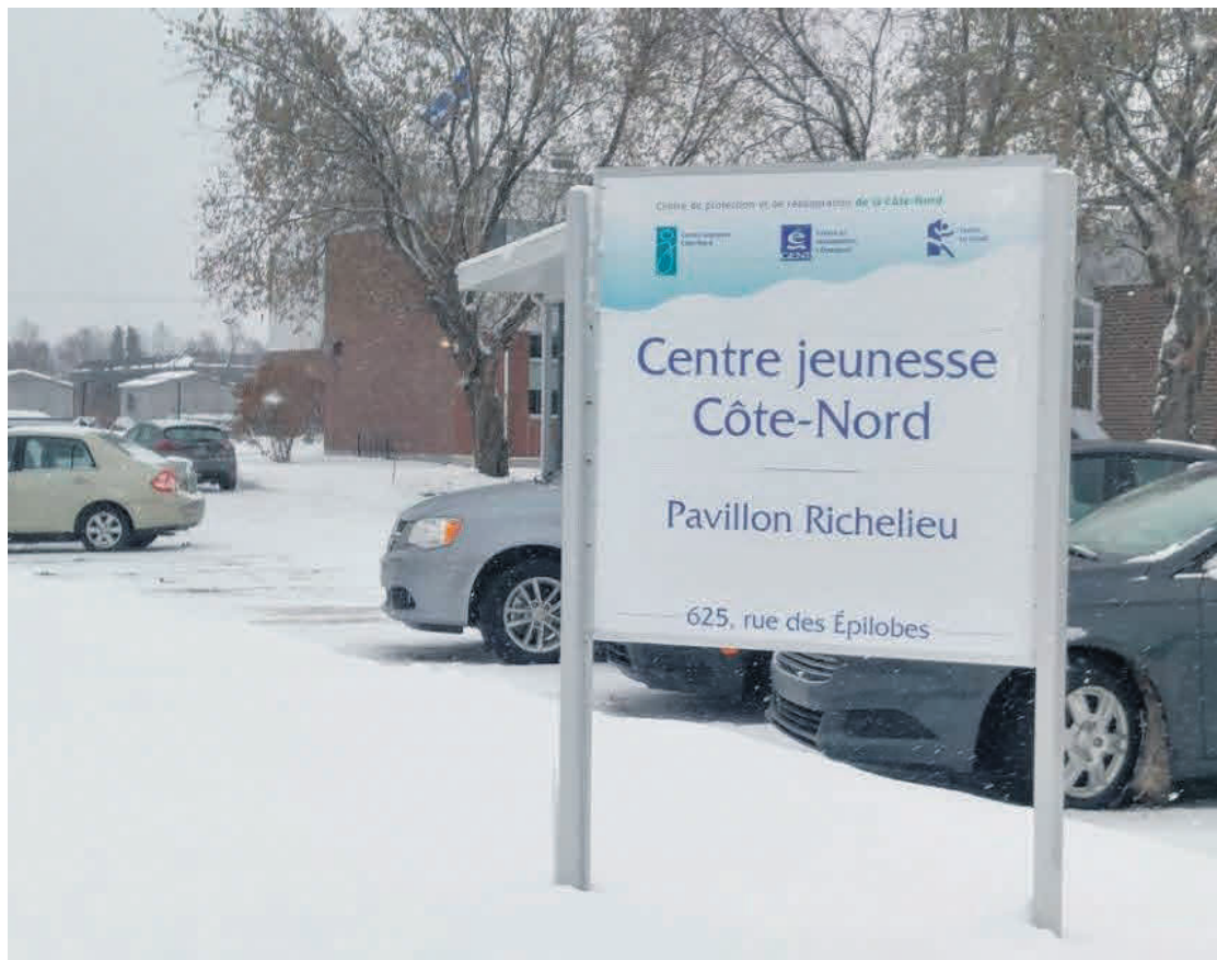
Deux employées du CISSS de la Côte-Nord ont contribué à un reportage dénonçant des lacunes observées au Pavillon Richelieu.

Les partis d'opposition se sont indignés du traitement