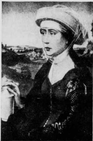
SAINTE MADELEINE par Van der Weyden