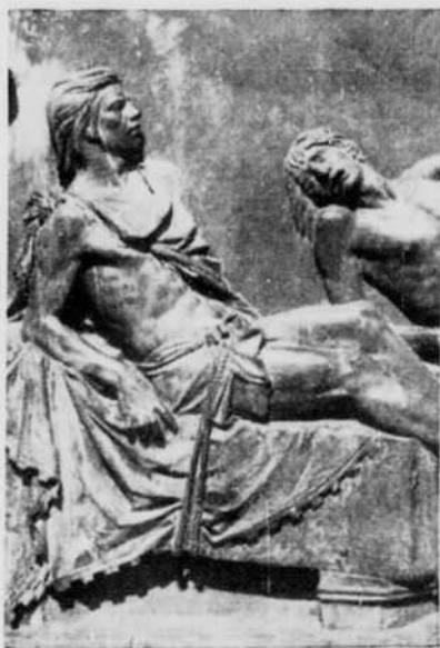
SUPPLICE DE CUAUHEMOC bas-relief de G. Guerra

Terre bénie, terre maudite de Gustav Regler est un ouvrage d'un intérêt soutenu, d'une documentation qui ne s'embarrasse pas de brouilles, d'une sympathie à chaque page évidente mais qui n'entame jamais l'impartialité de l'auteur. Pour qui veut connaître le Mexique et découvrir la courbe de son évolution historique, politique et humaine, ce livre repré-