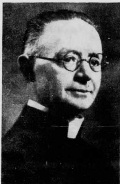
M. le chanoine Lionel GROULX