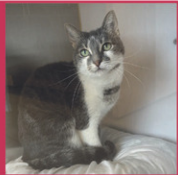
Trois-Rivières Oggy, femelle Domestique, 5 ans