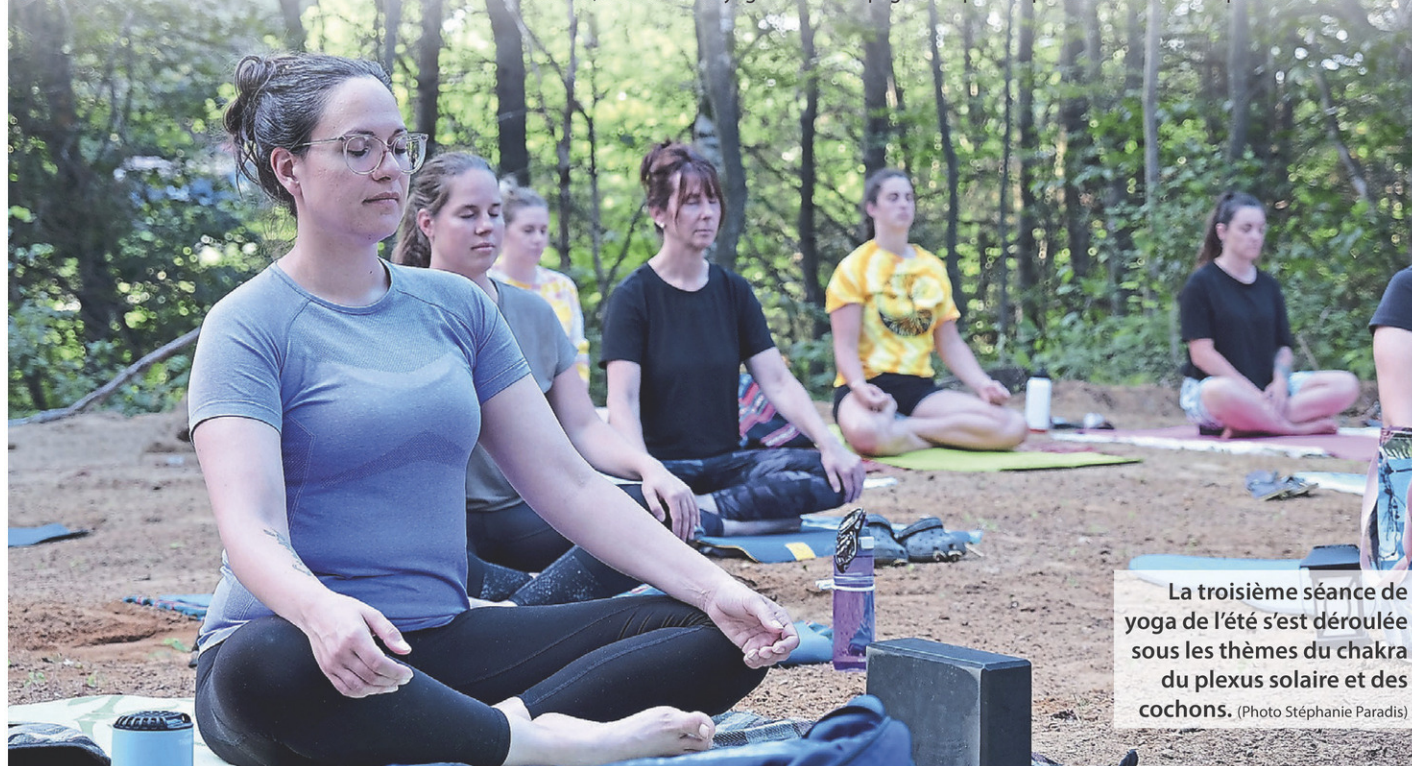
La troisième séance de yoga de l'été s'est déroulée sous les thèmes du chakra du plexus solaire et des cochons.

Et tous ces exemples ne sont qu'une parcelle de ce qu'est concrètement la Ferme La et par lesquels se traduit leurs valeurs: authenticité, qualité, liberté.