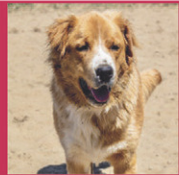
Trois-Rivières Gummy, mâle Grande race, 1 an