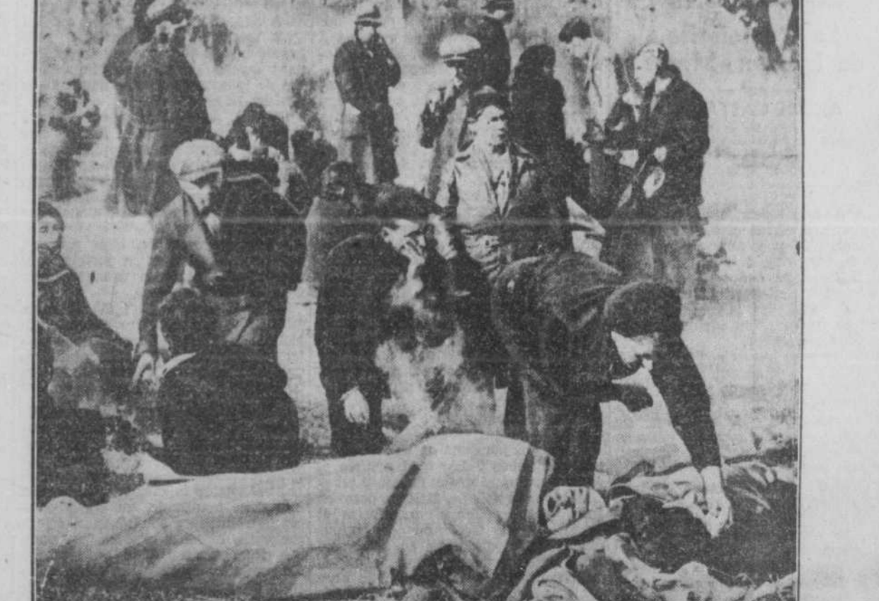
Noire vignette montre des marcheurs de la faim soignés des blessés, après leur bataille avec la police durant leur marche vers Albany, la capitale de l'état de New-York. On voit, au premier plan, un blessé auquel on donne des soins, pendant que des marcheurs se reposent des fatigues et des émotions des dernières heures.