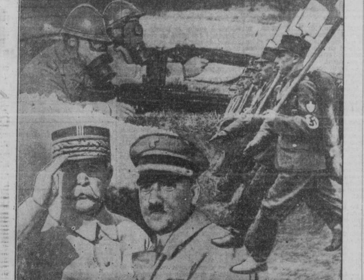
Des nuages de guerre planent sur l'Europe à mesure qu'approche le mois de janvier 1935, alors que sera tenu le plébiscite qui décidera du sort de la région de la Sarre. Le maréchal Henri Pétain, ministre de la guerre en France, a annoncé que son pays envahirait la région en moins de deux heures si les partisans de Hitler tentaient un putsch dans cette région aux jours du plébiscite. 16,000 résidents et partisans du parti nazi se feraient face aux envahisseurs si la France mettait sa menace à exécution.