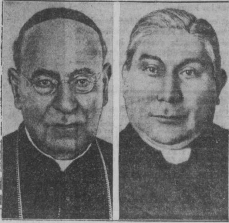
Ces deux prêtres de l'Eglise Catholique Romaine sont actuellement en butte à la persécution religieuse, au Mexique. A gauche, on voit l'archevêque RUIZ Y FLORES, délégué papal qui est actuellement en exil à San Antonio; à droite, l'archevêque DIAZ DE MEXICO qui se prépare à quitter son pays.