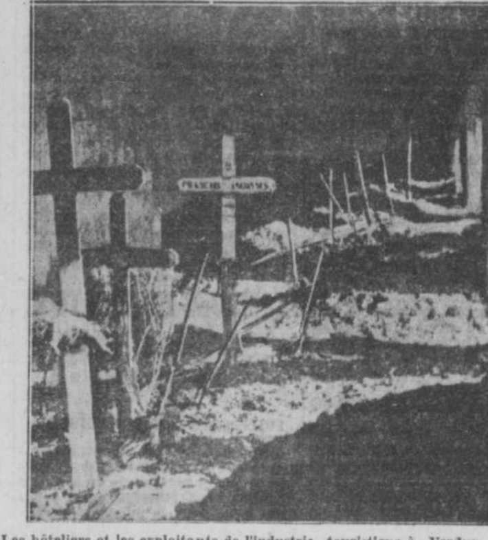
Les hôteliers et les exploitants de l'industrie touristique à Verdun, France, s'alarment actuellement du fait que pourrait s'accroître la rumeur suivante: la fameuse tranchée des baionnettes serait une mystification? Cette tranchée que l'on voit ici, était sensée contenir les ossements de toute une compagnie de soldats enterrés vivants, fusils et baionnettes au poing, au moment d'une attaque. Or il n'y aurait pas d'ossements de poilus dans cette tranchée, si on en croit la rumeur publique. Cette tranchée que l'on a protégée des intempéries par un revêtement de béton est visitée à chaque année par des milliers de touristes.