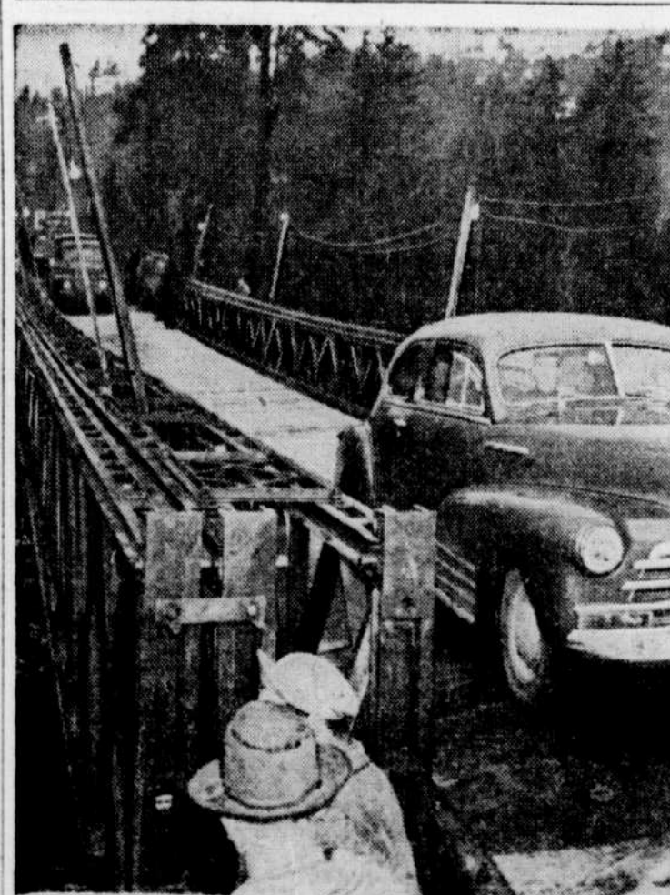
LE GENIE MILITAIRE de l'armée canadienne a terminé hier la construction de ce pont "Bailey" qui remplacera temporairement le pont de la Capilano, dans la partie ouest de Vancouver. Le pont