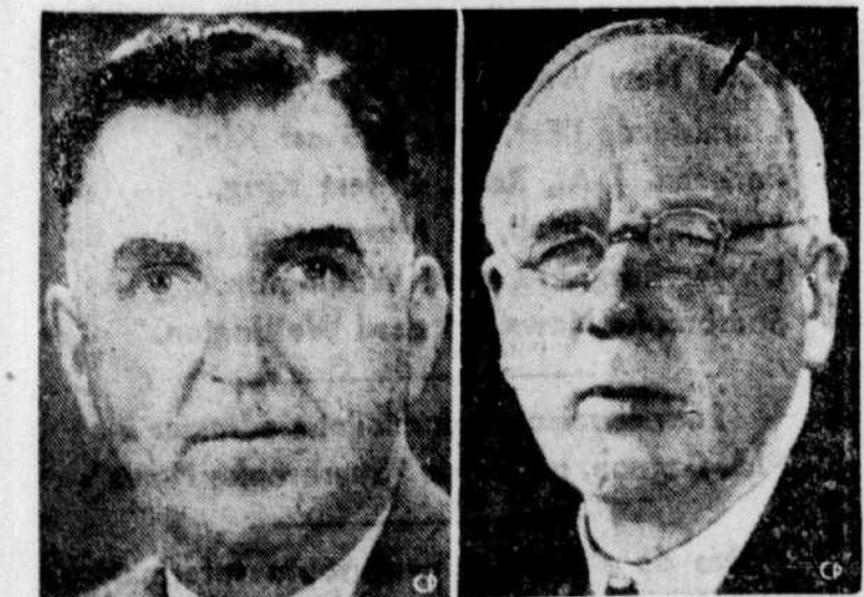
LE VAINQUEUR ET LE VAINCU — M. Sydney George Holland (à gauche) est le nouveau premier ministre de Nouvelle-Zélande. Son parti "national" (conservateur) a défait le gouvernement travailliste de M. Peter Fraser (à droite) au pouvoir depuis 14 ans.

Cette grève constituait une épreuve capitale de force pour la C.G.T.I. italienne, qui compte 5.000.000 de membres; elle avait ordonné à ceux d'entre eux employés dans les services publics essentiels de demeurer seuls au travail. Mais, en face d'elle, s'élevait la Fédération des unions ouvrières anticommunistes, qui groupe 2.000.000 d'hommes et qui avait reçu l'ordre de combattre la grève de toute manière.