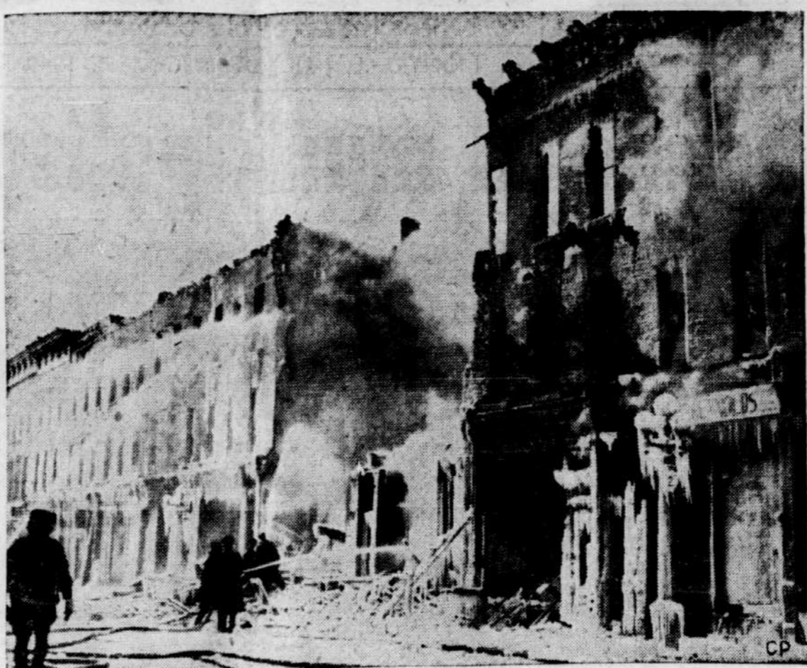
$1,000,000 EN FUMÉE — Ce qui reste de quatre magasins entièrement brûlés et de six autres gravement endommagés apparaît sur cette photo. Il s'agit d'un incendie qui est arrivé la semaine dernière à Brockville, Ont., et que les pompiers ont dû combattre par un froid de zéro degré.

La pêche, tout d'abord, n'a pas été excellente en tous points. Puis le manque du bois pour étonner des mines s'est entièrement tari pendant que se rétrécissait celui de la pâte de bois au sulfite. Enfin les trois bases aériennes des Etats-Unis dans l'île ont congédié leur personnel civil recruté sur les lieux, ce qui a créé un chômage au moins temporaire aux alentours. Terre-Neuve présente cet incon-