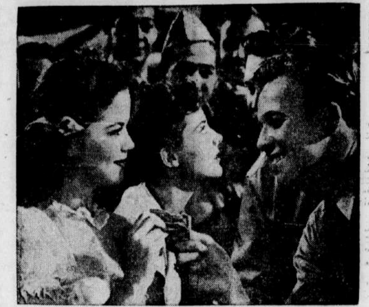
SHIRLEY TEMPLE a toutes les qualités pour jouer L'APPRENTISSAGE AMOUREUX... L'Electra présentera cette délicieuse comédie à partir de samedi prochain.