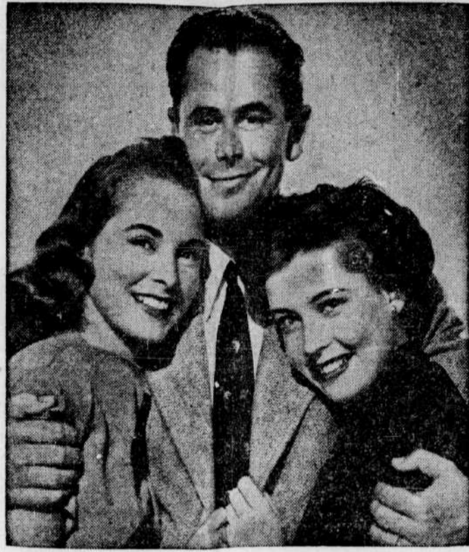
GLENN FORD ne semble pas intimidé par la compagnie galante qui l'entoure (Janet Leigh et Gloria de Haven) . . . il est vrai que Glenn est lui aussi "né à Québec". Cette scène est extraite du film THE DOCTOR AND THE GIRL , qui présentera le cinéma Palace à partir de vendredi.

Ceux qui désirent assister à l'émission en la salle de l'Ermitage, rue Guy, à Montréal, doivent demander leurs billets à la compagnie Borden, chambre 400, 407 rue McGill, Montréal.