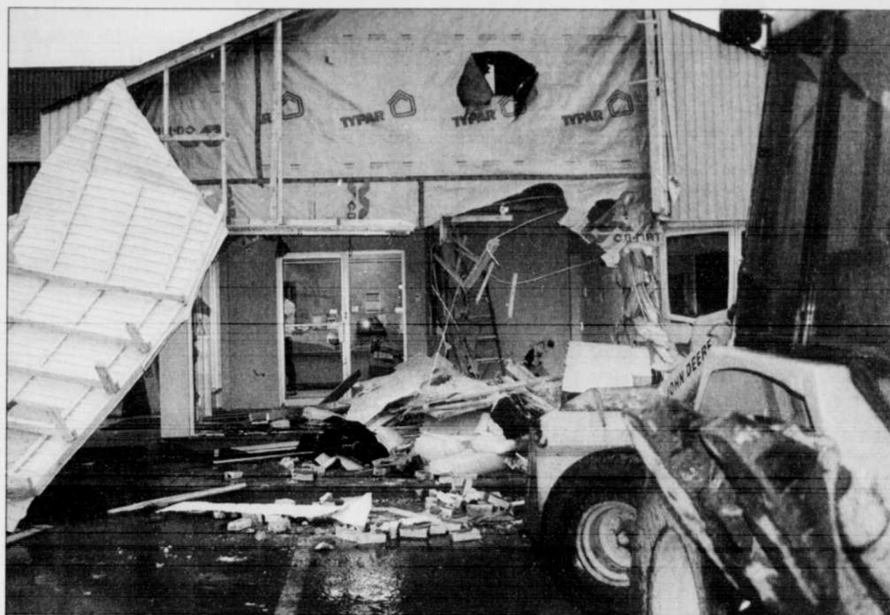
Rien n'a pu être volé à la caisse populaire mais les dommages sont sommairement évalués à plus de 100 000 $.