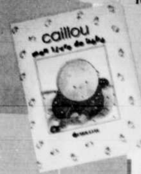
Caillou mon livre de bébé

Remplissez ce coupon et postez-le avant le 18 décembre à: Les poupons de l'année 1996 LE SOLEIL - C.P. 15808, Succ. Terminus Québec G1K 8A8 ou déposé-le avant le lundi 23 décembre, 14h, au Soleil, 925, chemin St-Louis, Québec