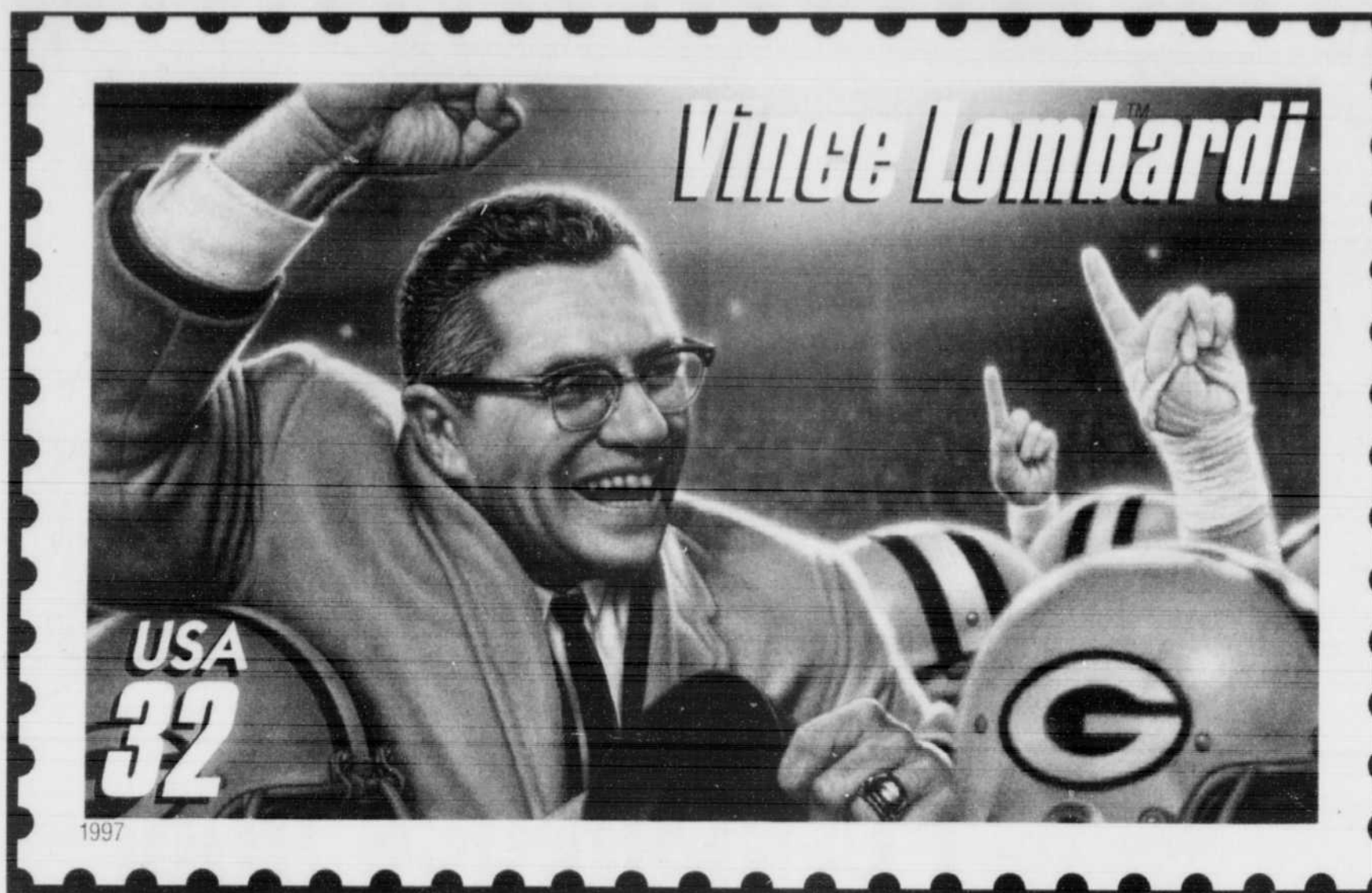
Le légendaire Vince Lombardi, l'ex-coach des Packers de Green Bay, est l'un des quatre entraîneurs de football qui seront honorés par le Service postal américain dans la série «Les coaches légendaires».