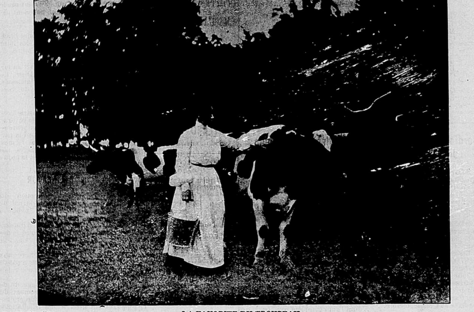
LA FAVORITE DU TROUPEAU.