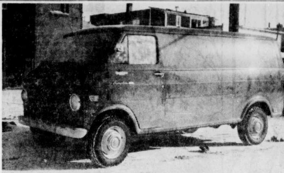
LA CAMIONNETTE — La photo nous fait voir la fameuse camionnette qui a subi, pour la deuxième fois en moins de deux mois, les assauts de bandits armés et masqués. Heureusement, le conducteur a eu la présence d'esprit de verrouiller ses portes à la suite de son expérience du mois d'octobre dernier.