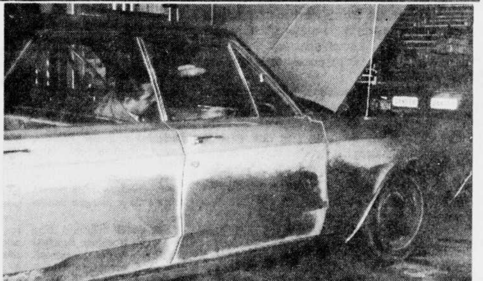
LA CHRYSLER 68 — On aperçoit ici le sergent-détective St-Cyr, de la Sûreté municipale de Drummondville, effectuant un relevé des empreintes digitales sur la voiture qui a été retrouvée dans le stationnement de Vaillancourt et Fils, de Drummondville.