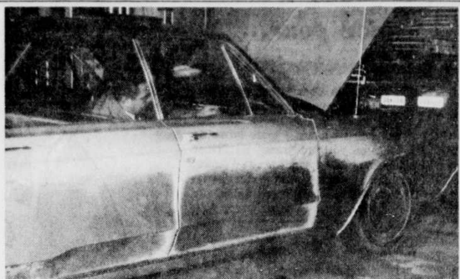
LA CHRYSLER 68 — On aperçoit ici le sergent-détective St-Cyr, de la Sûreté municipale de Drummondville, effectuant un relevé des empreintes digitales sur la voiture qui a été retrouvée dans le stationnement de Vaillancourt et Fils, de Drummondville.