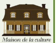
Maison de la culture