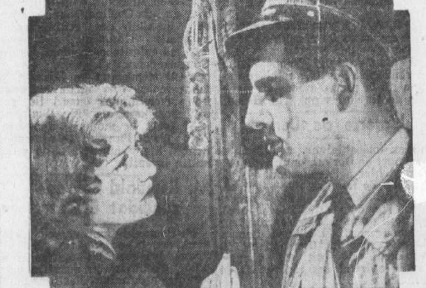
Le couple Edwige Feuillère et Jean Chevrier, en vedette dans le film "L'Emigrante", aujourd'hui au Saint-Denis.