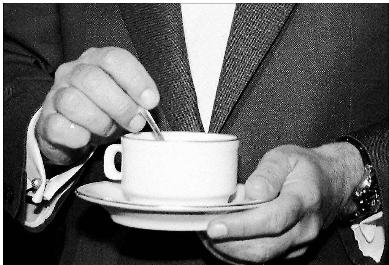
La pause-café, au bureau, est parfois l'occasion de brassage d'idées. Attention! votre voisin pourrait y puiser un trait de génie et tout prendre à son compte.

« Pour choisir ses alliés, il faut faire une bonne lecture de la culture et des pratiques de son organisation. Les gens qui ont le plus de pouvoir ou qui sont les plus visi-