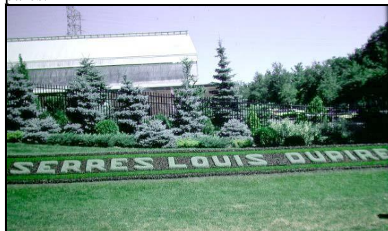
Les serres Louis Dupire, boulevard Pie IX

au tout début de la création du Service des parcs en 1953. C'est aussi au même endroit que les menuisiers et les peintres préparaient les jeux et tout l'attirail mobilier du Service des parcs. Un atelier de mécanique gardait en opération des centaines de tondeuses et autres outils nécessaires à l'entretien des parcs.