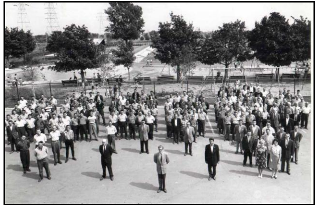
Photo prise en 1960 - Personnel de la Division des arbres devant les portes du garage des serres Louis-Dupire. Où suis-je ?

C'est le grand luxe. Les vitres sont remplacées par des panneaux d'acrylique rigides fabriqués un peu comme le carton brun (Coroplast); il est imperméable, léger et résistant aux chocs. De plus, il est traité contre les rayons UV et rivalise avec les meilleures fenêtres énergétiques portant le logo "Energy Star". Pour assurer le chauffage, on y utilise toutes les dernières technologies comme les pompes à chaleur, la géothermie, etc.