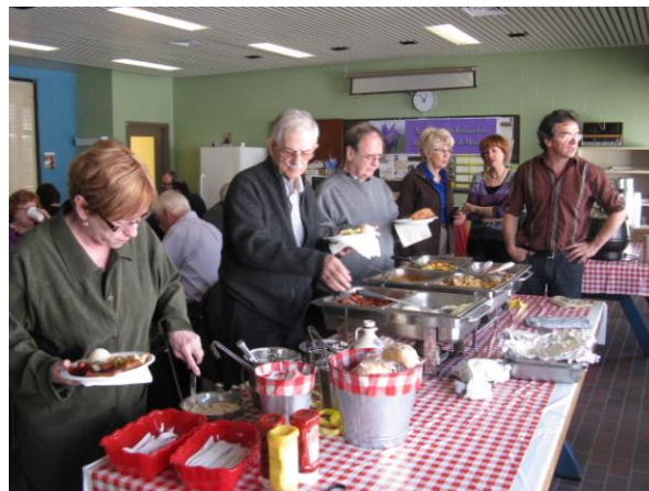
Choisir avec parcimonie