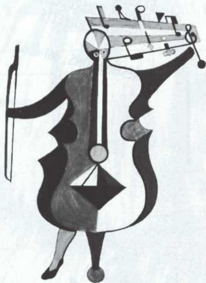
Alfred Pellán, Musicien B, 1946.